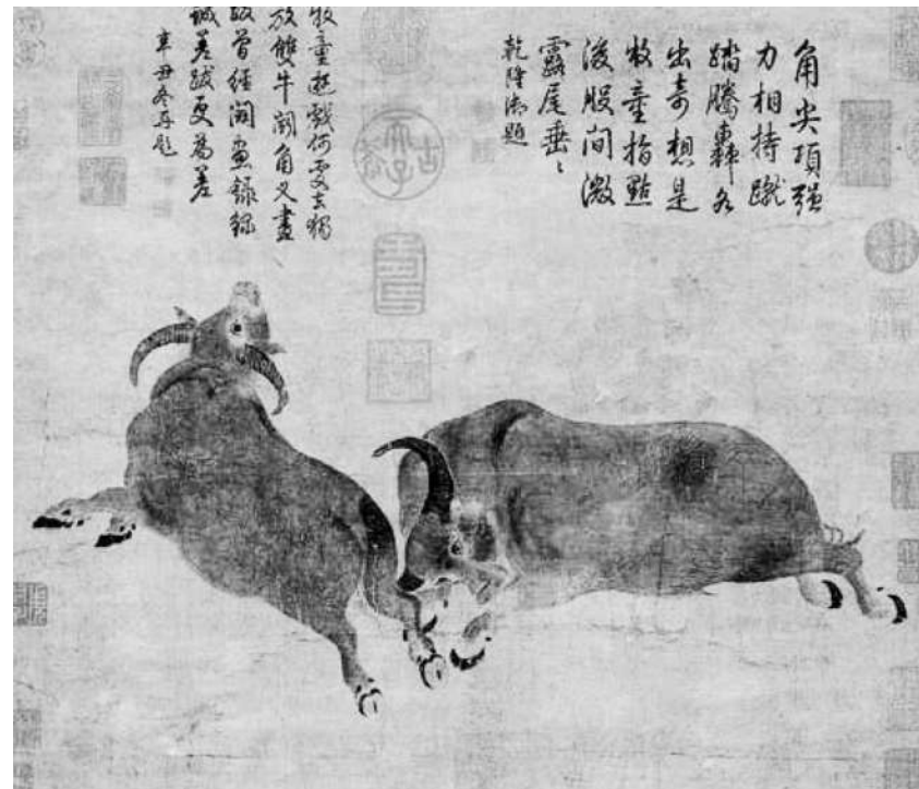
▲斗牛图 (唐)戴嵩 作

广大美术工作者要立足新时代的历史坐标，投身文化强国建设的伟大进程，坚持以人民为中心的创作导向，着眼促进满足人民文化需求和增强人民精神力量相统一，体现文化艺术审美功能和精神培育引领功能相统一，推出更多思想精深、艺术精湛、制作精良相统一的优秀作品，为时代画像、为时代立传、为时代明德。让我们以优异的成绩迎接中国共产党成立100周年，在新的伟大征程上创造新的时代辉煌、铸就新的历史伟业！