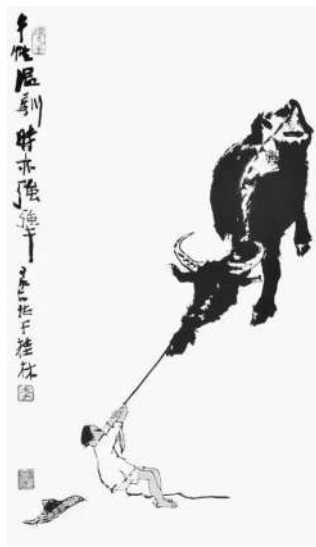
▲犟牛图 李可染 作

人民需要艺术，艺术更需要人民。正是在社会主义文艺旗帜的引领下，我们一代又一代美术工作者认真