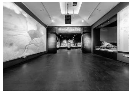
▲“泱泱华夏·择中建都”陈列展厅

国之重宝，见证了河南博物院的成长岁月，是河南博物院17万件藏品中被公认的镇院之宝。它通高117厘米，重64.5公斤。壶身为圆角方形，颈部两侧装饰了两条龙形怪兽构成双耳，腹部四周四条翼龙仿佛正在缓缓向上爬行，底部两只卷尾兽似乎正在倾其全力承托器身。最引人瞩目的是上层盖顶怒放盛开的双层莲瓣，中央伫立一只引颈欲鸣、展翅欲飞的仙鹤，仿佛冲破商周青铜世界的狰狞恐怖、神秘威严，预示着中国的历史和文化走向了一个百家争鸣、思想自由的崭新时代，更以其多范合铸的铸造工艺成为“青铜时代的绝唱”。春秋时期，社会变革、人文兴盛，这一时期的青铜艺术达到了前所未有的高度。莲鹤方壶兼收南北文化之长，繁复华丽与简约净素之美并存，反映出一种新的生活观念与艺术追求，是此时精神力量的时代化身，成为中原文化、中华之美的不朽之作。