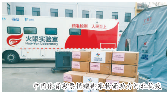
中国体育彩票捐赠物资助力河北抗疫

三月春风和煦，万物呈现生机。全国两会踏着春天的脚步，肩负人民的期待如约而至，这一时刻，既是总结过去，向人民交上答卷，也是凝聚共识，指引未来发展的航向。 时间的年轮铭刻着发展的轨迹，深刻见证了2020年的极不平凡。这一年是决胜全面建成小康社会、决战脱贫攻坚之年，也是“十三五”规划收官之年。这一年，中国体育彩票紧跟国家发展步伐，为疫情防控、脱贫攻坚以及全民健身、健康中国 and 体育强国建设贡献了力量。