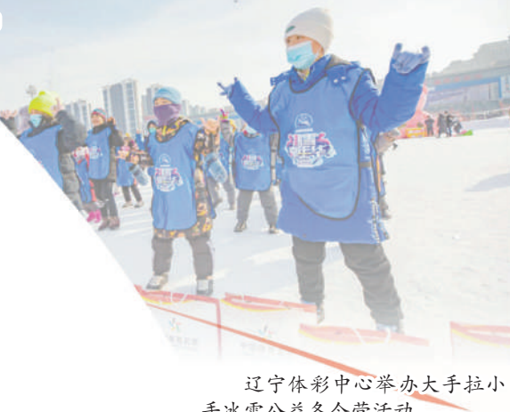
辽宁体彩中心举办大手拉小手冰雪公益冬令营活动