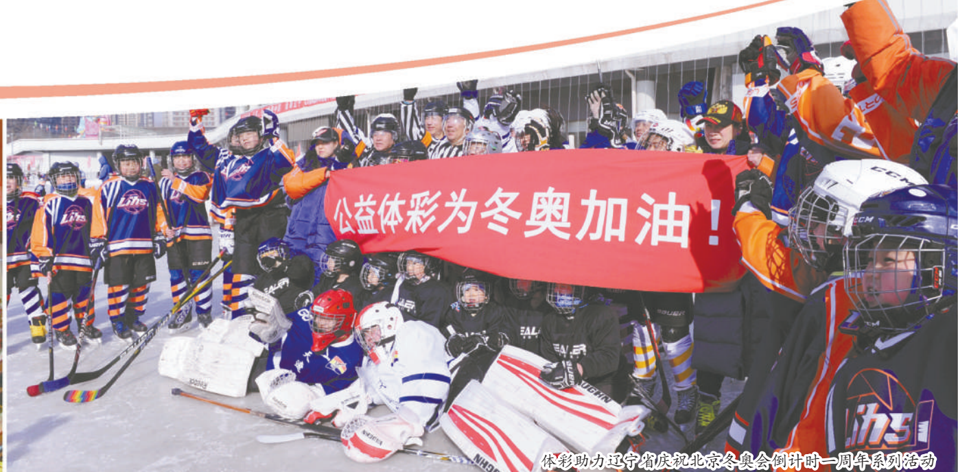
体彩助力辽宁省庆祝北京冬奥会倒计时一周年系列活动