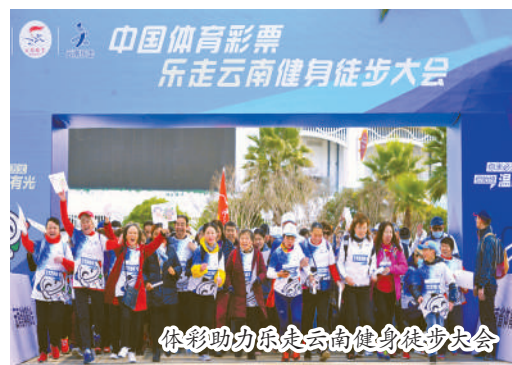
体彩助力乐走云南健身徒步大会

2022年北京冬奥会的脚步声越来越近，各项工作有序进行，中国冰雪运动基础不断夯实，“三亿人参与冰雪运动”正从愿景走向现实，这些工作的背后，也有体彩公益金的身影。