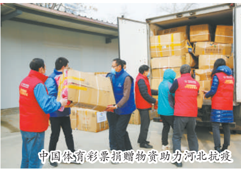
中国体育彩票捐赠物资助力河北抗疫

2020年，面对突如其来的新冠肺炎疫情，中国人民风雨同舟、众志成城，构筑起疫情防控的坚固防线。全国体彩人或向险而行，或默默坚守，以各种方式为疫情防控贡献力量。