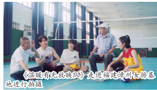
《温暖有光放映队》走进福建漳州女排基地进行拍摄

那些有温度、有情怀的场景，仍在记忆和影像里闪亮。从“相约体彩”所展现的责任担当，到“微光海洋”公益平台助力众多公益梦想的实现，从“点亮健康中国”燃起健身热潮，到民间棋王走进街头巷尾的体彩店；从“益起来 绘精彩”体彩吉祥物征集，到“见证公益的力量”添彩幸福中国梦；从携手电影人推出扶贫主题纪实节目《温暖有光放映队》，到“发现身边的公益”走进百姓身边的体彩公益金支持项目；从“健康，从公筷开始”守护舌尖上的安全，到“寻找微光公益见证官”……体彩在这一年始终传递“好声音”，传播正能量。