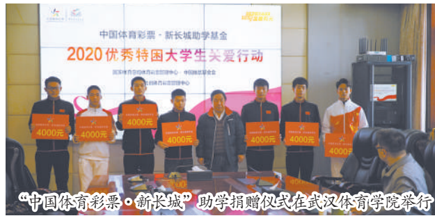
“中国体育彩票·新长城”助学捐赠仪式在武汉体育学院举行