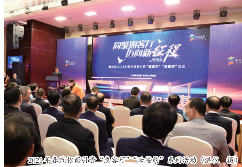
2021年春节招商引资“惠客厅”“云签约”系列活动