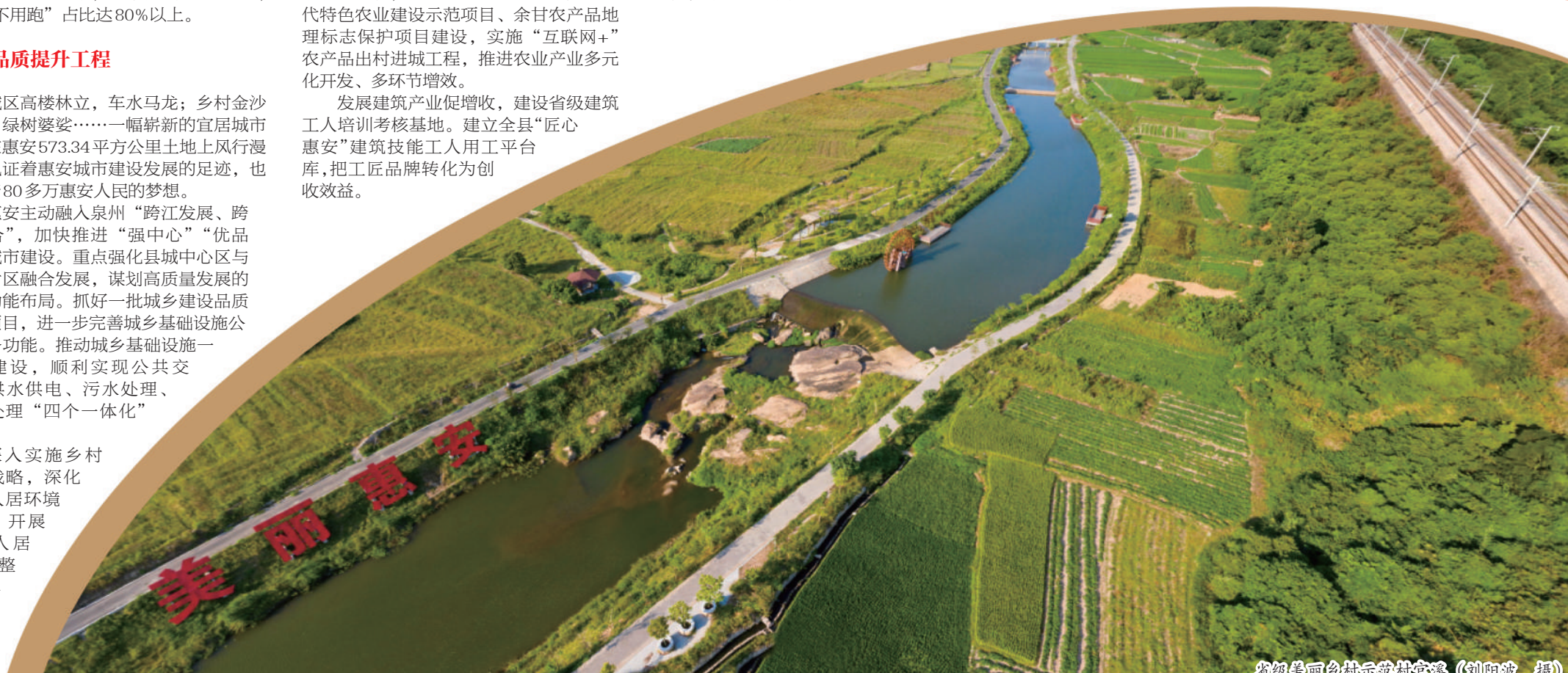
省级美丽乡村示范村官溪