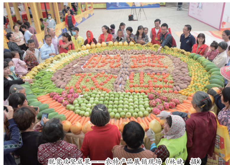
脱贫攻坚成果——农产品展销现场