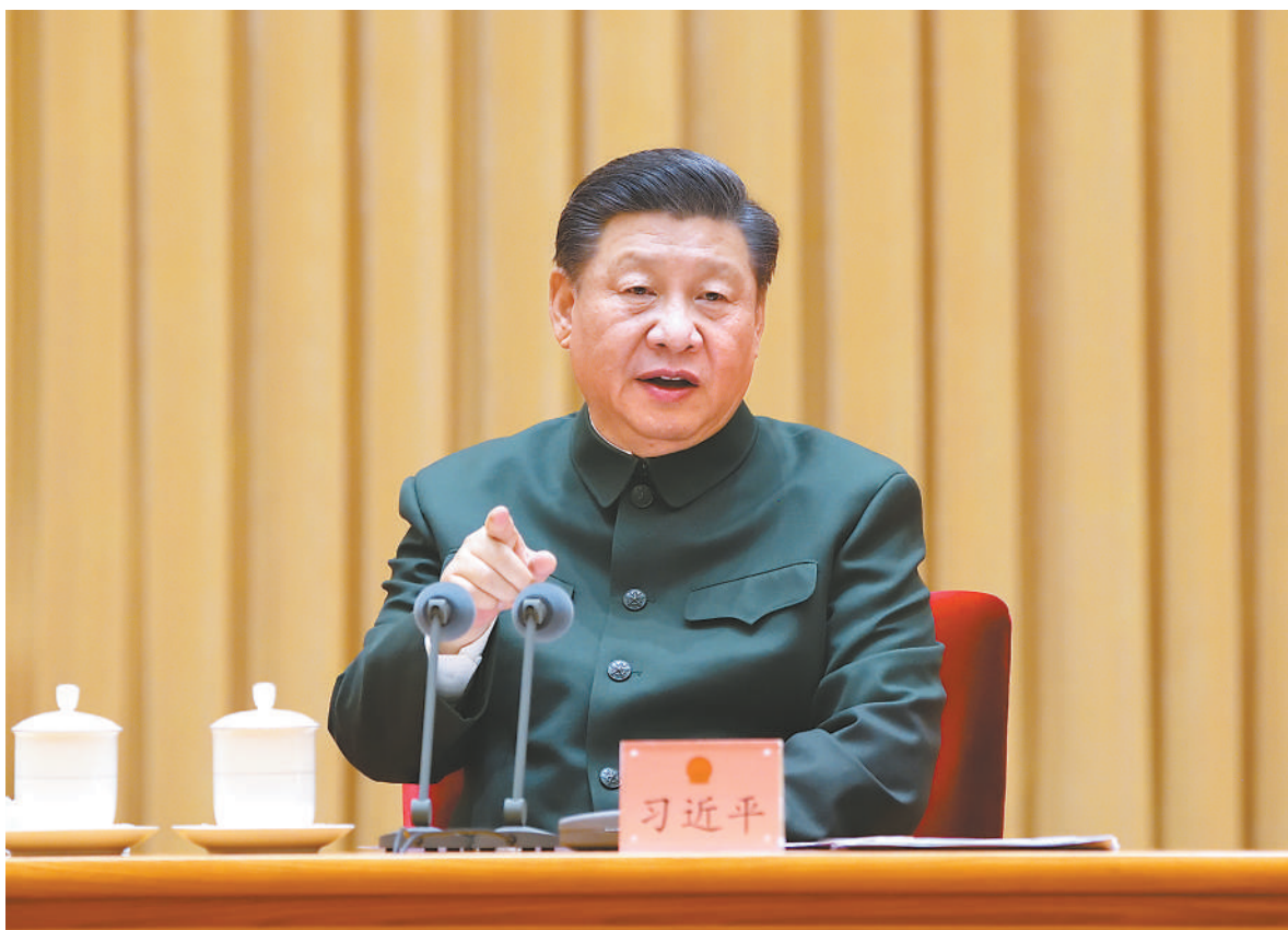
3月9日下午,中共中央总书记、国家主席、中央军委主席习近平出席十三届全国人大四次会议解放军和武警部队代表团全体会议并发表重要讲话。

习近平结合规划实施,就做好“十四五”时期国防和军队建设开局起步工作提出要求。他强调,要深刻领会党中央和中央军委决心意图,聚焦实现建军100年奋斗目标,紧紧围绕我军建设“十四五”规划布局谋