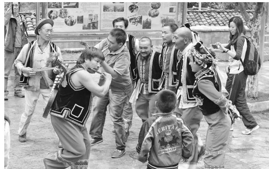
▲ 传统节日中的彝族民间舞表演

在临近端午的时候，也就是每年枇杷变黄的时候，也是医生最忙的时候。因为这一时段正是夏季瘟疫流行病的高发期。为了躲避瘟疫，人们就会在村门寨口拉起一条绳子，再在绳子上绑上些白布条，这便是我们常说的“禁绳”。外人看见“禁绳”就不再进村，瘟疫也就传不进来了。但是，瘟疫一旦进了村又怎么办呢？古人以为瘟疫之所以流行，是瘟神在作怪，这时候就得驱赶瘟神。怎么驱赶呢？在水乡泽国，人们主要采取两种方式送瘟神：一种是做一只纸船，把瘟神的偶像摆在上面，再点上支蜡烛，让它顺流而下，瘟神就这样送走了。这便是毛泽东在《七律·送瘟神》当中所说的“借问瘟君欲何往，纸船明烛照天烧”，讲的就是这样一种民俗；还有一种做法，便是把瘟神的偶像放在小船上，再放上些粽子等祭品，然后驾起小船，让它顺流而下，到了水流湍急处，把瘟神和祭品往水里一扔，瘟神便这样被“送走了”。如果只是一家一户、一村一寨这么做，也许就没有后来的故事了。但是如果家家户户、村村寨寨都想送