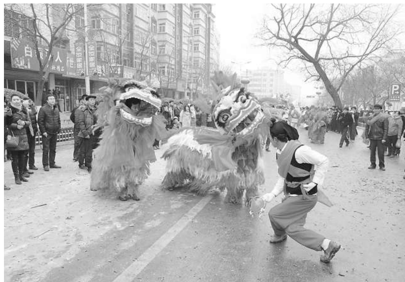
▲ 闹元宵的陇南舞狮

禅师庙会。尤溪刚刚开发之时，虎患猖獗，老虎吃牛导致耕牛数量急剧减少。这时来了位禅师，打死了老虎，从此人们才过上安逸的日子，在当地，人们也会通过一年一度的庙会来纪念这位救民水火英雄。