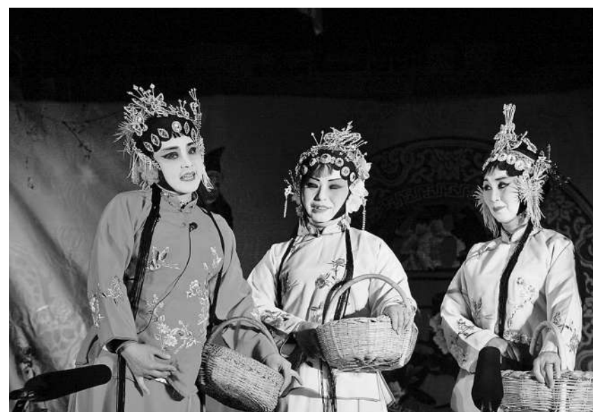
▲ 传统节日中的民间小戏

风易俗”之前，要认真考虑一下我们要移的“风”，易的“俗”，到底是恶风恶俗，还是良风良俗？如果是恶风恶俗，当然要移除，因为它影响了我们的社会发展。但如果是良风良俗，我们还移吗？