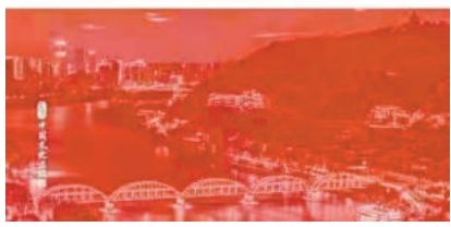
《政协协商的探索与实践》

形式,实现党对基层的全面领导,而且可以有效地化解基层利益矛盾,提升基层治理效能,是推进社会主义民主政治建设的必然要求;其次,当前政协协商已经成为我国公共决策中的重要一环,有力提升了国家治理体系的吸纳能力、科学决策能力和政策执行能力,它与党的全面领导,人大立法监督和政府行政执行共同构成了现代国家治理结构体系,将协商作为政协的主责主业是完善国家治理体系和实现国家治理能力现代化的需要;最后,人民政协作为统一战线组织和新型政党制度运行的重要平台,有责任将协商民主贯彻于中国共产党与各民主党派以及各民主党派自身之间的合作共事之中,在坚持和完善新型政党制度的同时,更好地实现党对新型政党制度的领导。