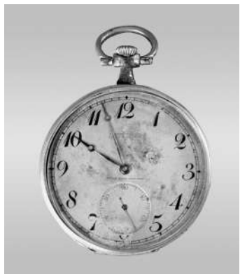
▲瞿秋白的怀表，现藏于中国人民革命军事博物馆。