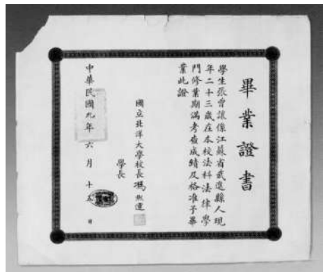
▲张太雷毕业证书，现藏于天津大学档案馆。

第四个特点，是富有年轻人朝气。100年前建党的那批人，除了极个别属于“80后”，基本上都是“90后”，还有少数是“00后”。当然，这个“80后”“90后”“00后”要比现在早一个世纪。当时建党的主体是“95后”，如今的“95后”正是风华正茂。回望百年，驻足脚下，中国共产党也依然朝气蓬勃，是个年轻的政党。这个年轻的政党对早期中国共产党的形象几乎难以复制，他们都是接受过五四新文化运动洗礼的。再从年龄结构来看，在中国共产党成立以后，除了陈独秀年长一点之外，其他都是20来岁、30多岁的人。做过粗略统计，大革命失败以后，瞿秋白、李立三先后主持工作。瞿秋白当时28岁，李立三29岁，包括任弼时23岁被选入中央政治局，24岁入选中央政治局常委，是党史上最年轻的政治局委员……这是一个年轻人组建的政党，它充满活力和朝气、乐观积极，着眼未来，把怀表送给你。徐海东就带着这块怀表参与了鄂豫皖战斗、长征以及