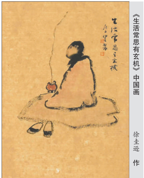
《生活常思有玄机》中国画