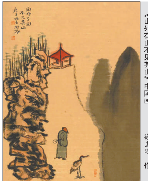
《山外有山不见其山》中国画