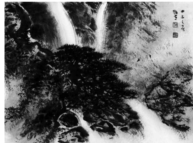
黎雄才《春之声》35cm x 45cm

市场等各种主观因素都在变化。”北京拍卖行业协会会长甘学军表示：“从北京拍卖行业来讲，无论是推广还是运营的观念模式，已经很少有纯粹只做线下的拍卖公司，更多公司着眼于线上线下的联合运营。因此，这种运营模式的更新，也需要更多新的观念、新的做法。”