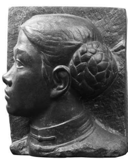
纪念碑浮雕《五四运动》人物头像，滑田友，1956年