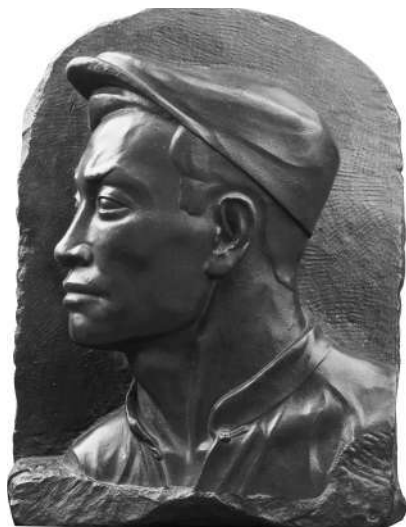
纪念碑浮雕《五卅运动》人物头像，王临乙，1956年

在国家博物馆“屹立东方——馆藏经典美术作品展”中展出了7件人民英雄纪念碑浮雕人物头像设计样稿，分别是滑田友雕刻的《五四运动》人物头像4件，王临乙雕刻的《五卅运动》人物头像1件，以及张松鹤雕刻的《抗日游击战》人物头像2件。这些人物形象并非某位历史人物或革命领袖，而是普通中华儿女的模样，他们表情生动，形象各异，以具象写实的造型，抽象概括了人民英雄这一伟大的群体，让我们依稀可以看到人民英雄纪念碑浮雕的雏形。创作者们综合借鉴中西方雕塑艺术的特点，按照“表现群体，不表现个体”的原则，以人民为主题，仔细研究每个革命史迹的特征、细节和当时的服装、用具，捕捉主题人物在所处历史环境下的心理、气质、感情等特征，用文学叙事的方法对人物进行侧写，使他们的形象更加生动和丰富。人民英雄纪念碑浮雕壁画是历史的缩影，高度概括了百年来