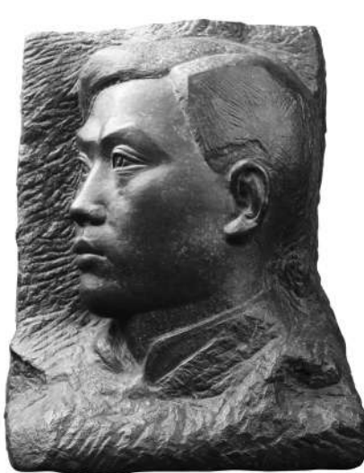
纪念碑浮雕《五四运动》人物头像，滑田友，1956年