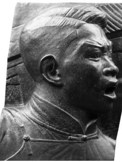
纪念碑浮雕《五四运动》人物头像，滑田友，1956年

中国人民为争取国家独立、民族解放的革命历程，再现了人民英雄在历史的关键时刻奋起抗争的激烈场景，不仅代表了我国浮雕艺术的最高水平，更是传统革命精神的象征。