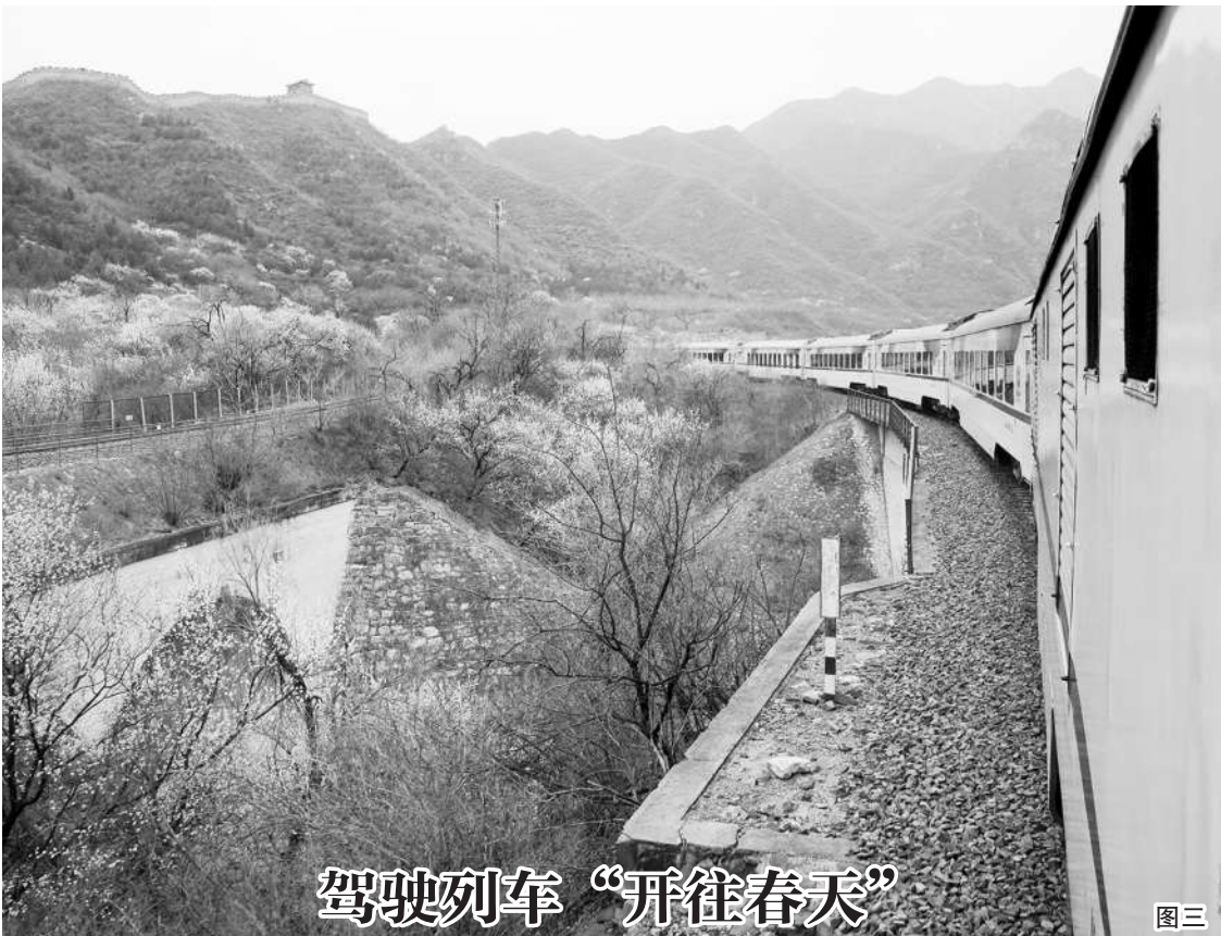
驾驶列车“开往春天”

“和谐长城号”列车穿越花海的美丽画面被中外游客盛赞为“开往春天的列车”,如今,它已成为美丽中国的一张名片。近日,摄影师来到北京市郊铁路S2线,用相机记录下驾驶“开往春天的列车”青年司机组生活。