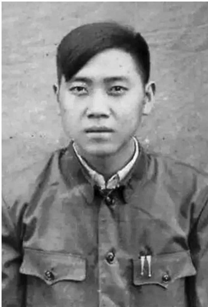
邱少云当年送给战友陈大权的留念照片

作战，1953年回国，他亲身经历和目睹了邱少云同志入伍和牺牲的全部过程。现根据马遂群老人的回忆，详述邱少云短暂而精彩的人生故事。