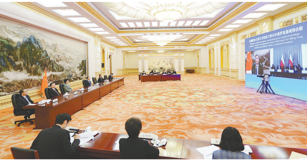
4月22日，全国政协主席汪洋在北京以视频方式会见波兰参议长格罗兹基。