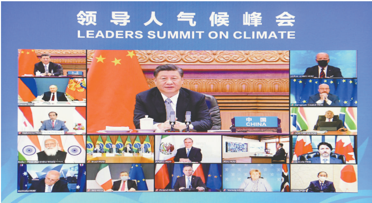
4月22日晚，应美国总统拜登邀请，国家主席习近平在北京以视频方式出席领导人气候峰会，并发表题为《共同构建人与自然生命共同体》的重要讲话。

新华社北京4月22日电 应美国总统拜登邀请，国家主席习近平22日晚在北京以视频方式出席领导人气候峰会，并发表题为《共同构建人与自然生命共同体》的重要讲话。