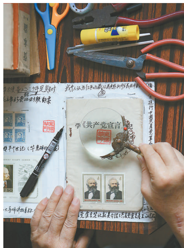
一件件珍贵的藏品，讲述着“中国共产党百年奋斗史”。