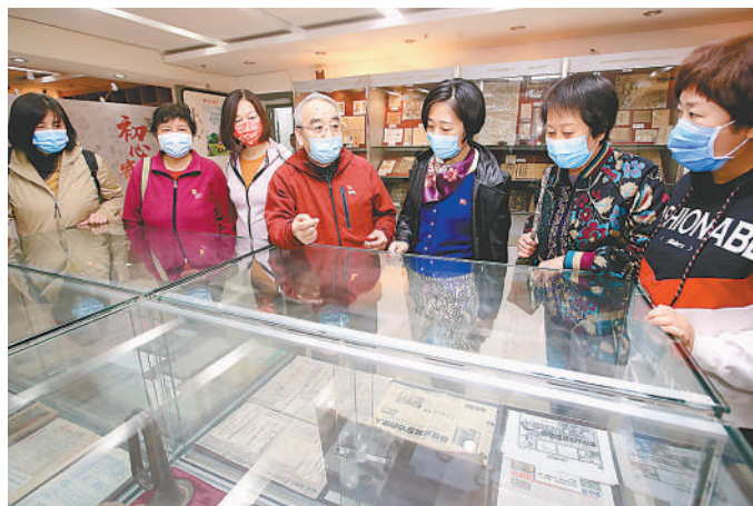
民众在「红色收藏馆」参观