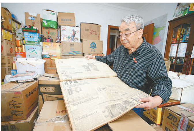
多箱、 八十多平方米的屋子里，堆放了一百