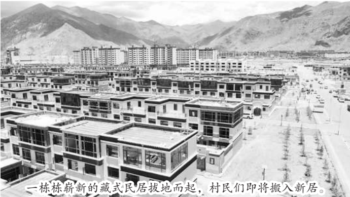
一栋栋崭新的藏式民居拔地而起，村民们即将搬入新居。