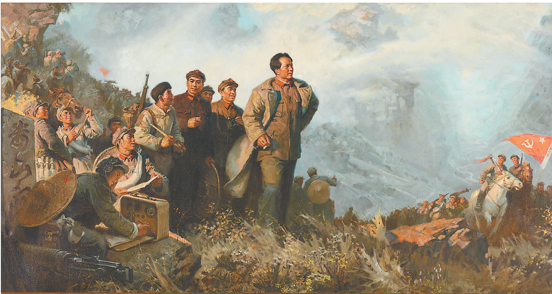
而今迈步从头越 (油画)

天地”展出了不同时期艺术家抒写峥嵘岁月、缅怀革命先烈、讴歌革命精神的经典作品，展示了党带领中国人民经历艰难探索和浴血奋战、完成建国大业的悲壮历程。“建设新中国”展现了在新的时代精神召唤下，艺术家们遵循党的文艺方针、以现实主义创作手法创作的作品。这些作品表现了热火朝天的社会主义建设景象，塑造了自豪、幸福的人民形象，展示了新中国成立以后整个社会积极向上的精神面貌。“迈步新时期”表现了在巨大的时代变革激发下，艺术家们解放思想、勇于创新的艺术追求，他们以开放的胸怀和多样化的手法，讴歌翻天覆地的时代巨变和丰富多彩的时代生活，展现了改革开放的辉煌成就和中华大地上的蓬勃生机。“奋进新时代”是近年来主题性美术创作成果的集中展示，艺术家们挖掘和表达新时代的精神内涵，描绘新时代的万千气象，作品洋溢着激越昂扬、欣欣向荣的精神面貌，展现出奋进新时代、迈向新征程的美好图景。