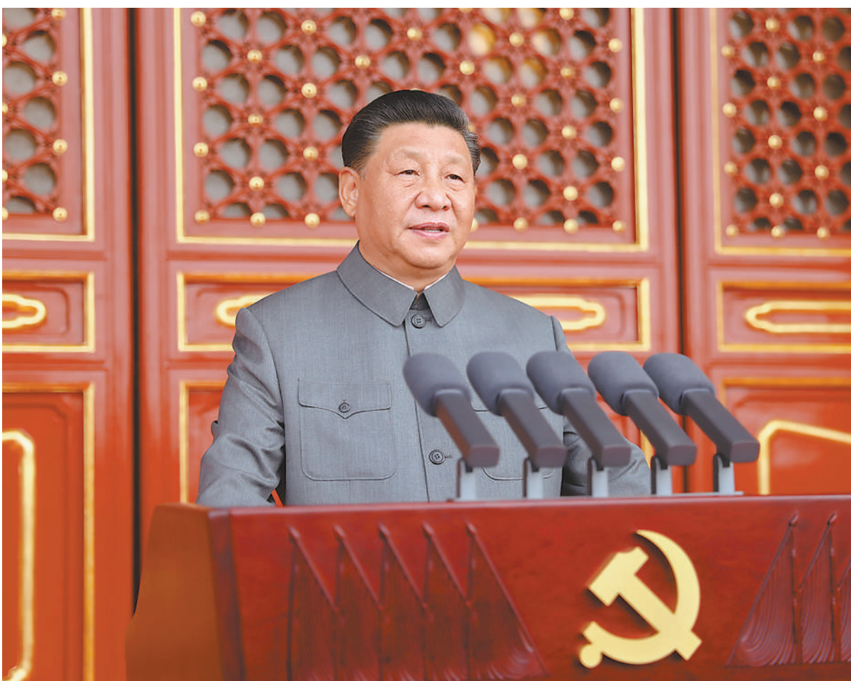
7月1日，庆祝中国共产党成立100周年大会在北京天安门广场隆重举行。中共中央总书记、国家主席、中央军委主席习近平发表重要讲话。