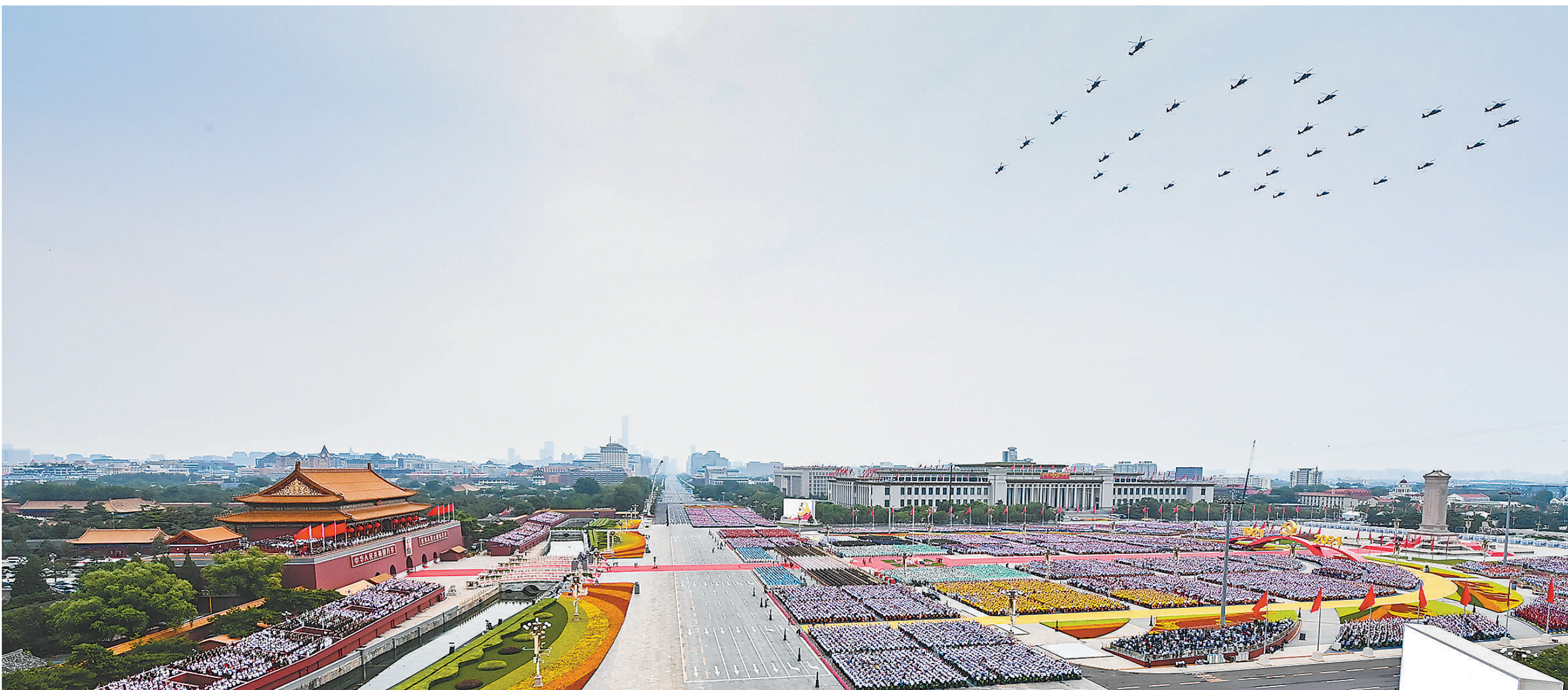
七月一日，庆祝中国共产党成立100周年大会在北京天安门广场隆重举行。

进。这是中华民族的伟大光荣，这是中国人民的伟大光荣，这是中国共产党的伟大光荣。中共中央政治局常委李克强主持庆祝大会。中共中央政治局常委栗战书、汪洋、王沪宁、赵乐际、韩正，国家副主席王岐山出席。（下转4版）