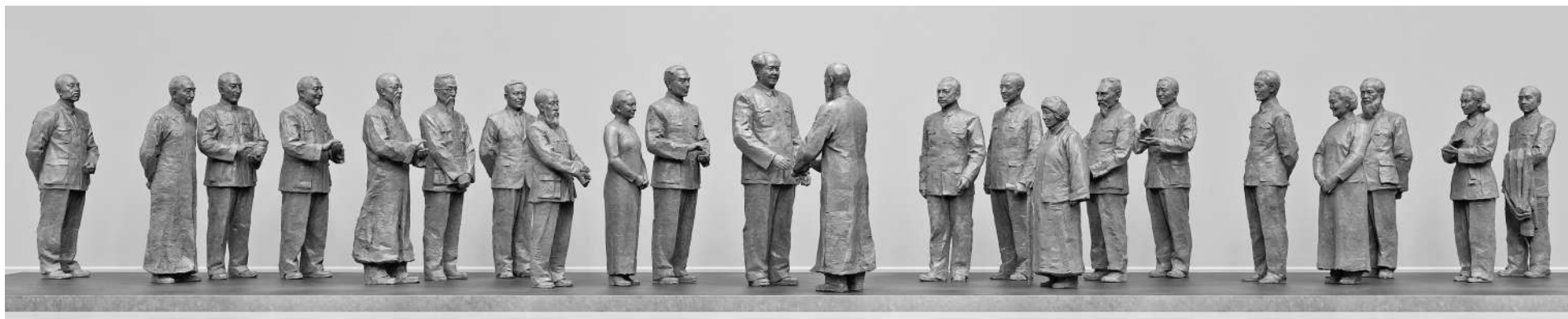
全国政协委员庆祝中国共产党成立一百周年书画作品展参展作品 雕塑《共商国是》 吴为山 作 (作者系全国政协常委,中国美术馆馆长)