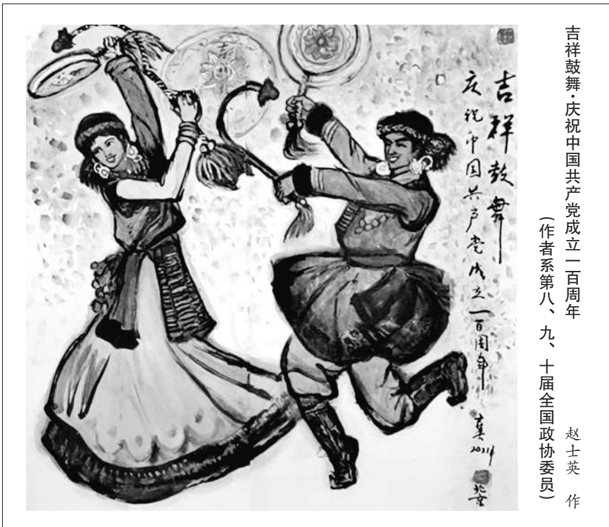
吉祥鼓舞·庆祝中国共产党成立一百周年 (作者系第八、九、十届全国政协委员)