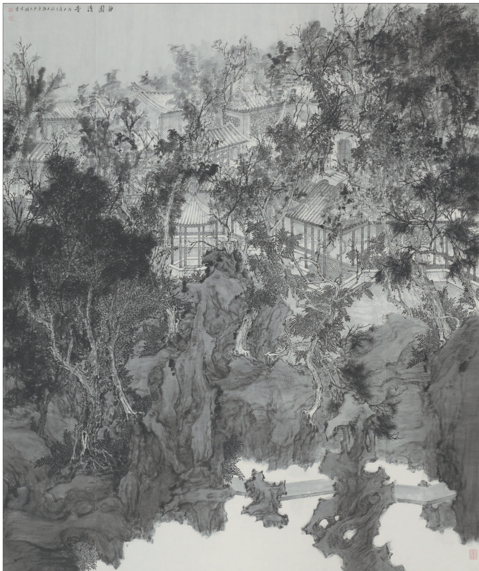
《曲园清音》中国画 200cm x 240cm

时下在园林造境中,有一个新鲜的名词称之为“声音景观”,不知古人在造园时,是不是也考虑或意识到了这些。当以视觉感受为核心内容的景观已经不能满足人们的需求时,其他感官(听觉、嗅觉、触觉、味觉)体验的景观设计开始引起重视。这其中听觉是仅次于视觉的重要感官。声音景观的设计在环境中起着不可替代的作用,声音可以加深人们对景观的印象,丰富一般人群对景观的感受。人们游走于景色优美