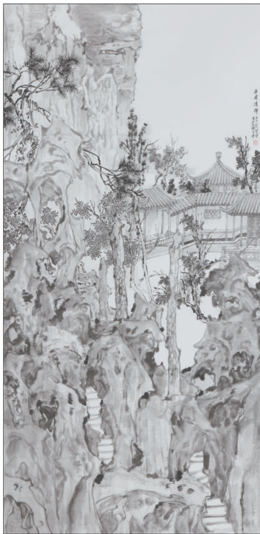
《曲园清晖》中国画 谢士强 作

的现代园林景观中,在得到视觉享受的同时,开始向往听到自然界的鸟鸣、蛙叫、风声、雨声、泉声等,怀念那些能引起人们回忆的声音。