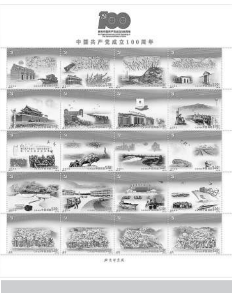
《中国共产党成立100周年》纪念邮票

《中国共产党成立100周年》纪念邮票、首日封和《从胜利走向胜利》专题册,选取了中国共产党成立100年以来所发生的重大历史事件、召开的重要会议及党史中的重要人物。其中,《中国共产党成立100周年》纪念邮票设计形式上采用连票,以红色、金色为画面主基调,运用油画写实手法表现,并采用连绵不断的飘带贯穿整体,寓意中国共产党百年奋斗的辉煌历程。“全套邮票分为5个部分,即新民主主义革命时期、社会主义革命和建设时期、改革开放和社会主义现代化建设新时期、中国特色社会主义新时代以及综