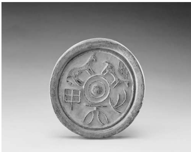
“甲天下”瓦当,西汉,直径19.8厘米。

瓦当是中国古代建筑构件中的一种,为筒瓦之头,有遮蔽檐头、阻止瓦片下滑的作用,故称“当”。