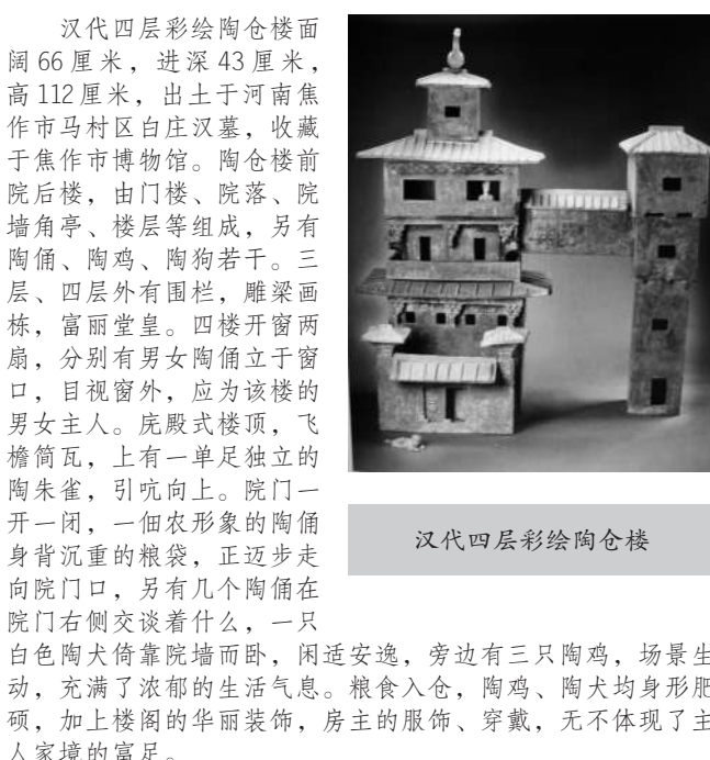
汉代四层彩绘陶仓楼

汉代四层彩绘陶仓楼面阔66厘米,进深43厘米,高112厘米,出土于河南焦作市马村区白庄汉墓,收藏于焦作市博物馆。陶仓楼前院后楼,由门楼、院落、院墙角亭、楼层等组成,另有陶俑、陶鸡、陶狗若干。三层、四层外有围栏,雕梁画栋,富丽堂皇。四楼开窗两扇,分别有男女陶俑立于窗口,目视窗外,应为该楼的男女主人。殿歇式楼顶,飞檐筒瓦,上有一单足独立的陶朱雀,引吭向上。院门一开一闭,一个农形象的陶俑身背沉重的粮袋,正迈步走向院门口,另有几个陶俑在院门右侧交谈着什么,一只白色陶犬倚靠院墙而卧,闲适安逸,旁边有三只陶鸡,场景生动,充满了浓郁的生活气息。粮食入仓,陶鸡、陶犬均身形肥硕,加上楼阁的华丽装饰,房主的服饰、穿戴,无不体现了主人家境的富足。