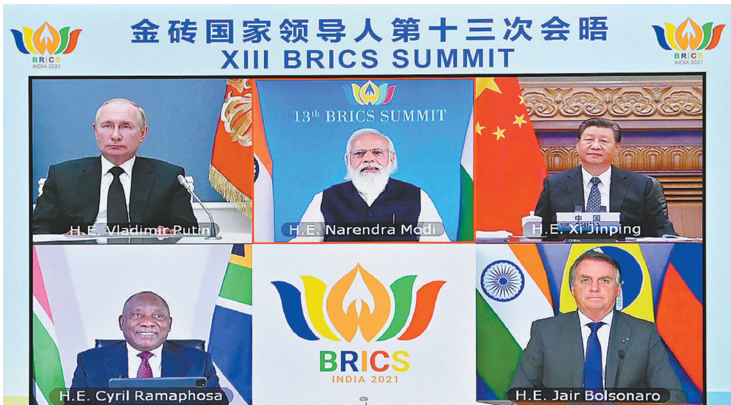
9月9日晚,金砖国家领导人第十三次会晤以视频方式举行。国家主席习近平在北京出席会晤并发表重要讲话。南非总统拉马福萨、巴西总统博索纳罗、俄罗斯总统普京出席,印度总理莫迪主持会议。

新华社北京9月9日电 金砖国家领导人第十三次会晤9日晚以视频方式举行。中国国家主席习近平、南非总统拉马福萨、巴西总统博索纳罗、俄罗斯总统普京出席,印度总理莫迪主持会议。 习近平指出,今年是金砖国家合作15周年。15年来,五国坚持开放包容、平等相待,增进战略沟通和政治互信,尊重彼此社会制度和发展道路,不断探索正确的国与国相处之道;坚持务实创新、合作共赢,对接发展政策,发挥互补优势,扎实推进各领域务实合作,在共同发展的道路上砥砺前行;坚持公平正义、立己达人,支持多边主义,参与全球治理,成为国际舞台上不可忽视的重要力量。今年以来,五国克服新冠肺炎疫情影响,推动金砖合作保持发展势头,在很多领域取得了新进展。事实证明,无论遇到什么困难,只要我们心往一处想、劲往一处使,金砖合作就能走稳走实走远。