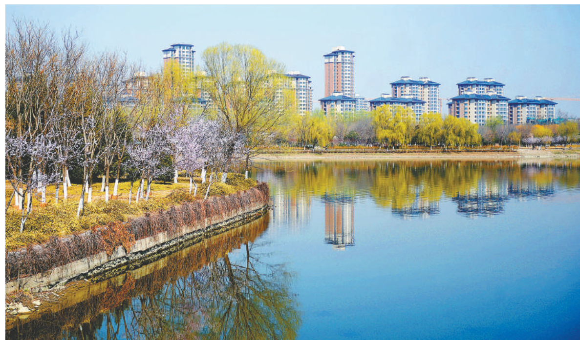
通州大运河办公区配套建筑和运河交相辉映，风景优美。