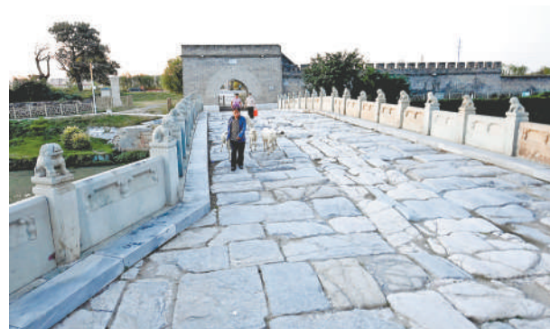
通运桥是北京通州张家湾城南门外的一座古桥遗址，也称萧太后桥。