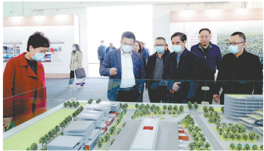
通州区政协调研运河商务区规划。