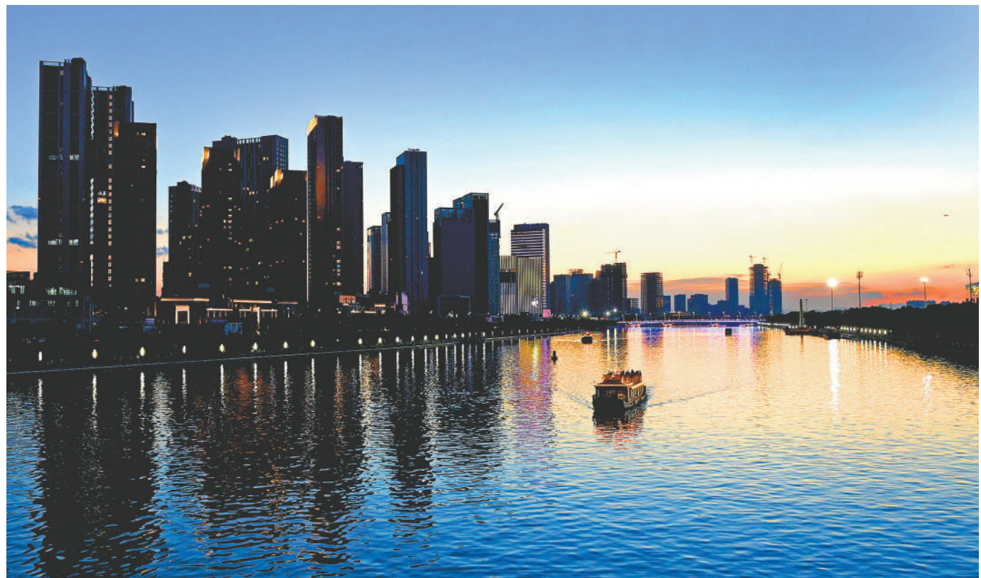
京杭大运河北京段40公里全线实现旅游通航。