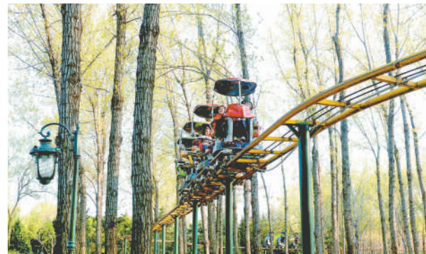
大运河森林公园游乐园，孩子们在体验空中漫游游乐项目。