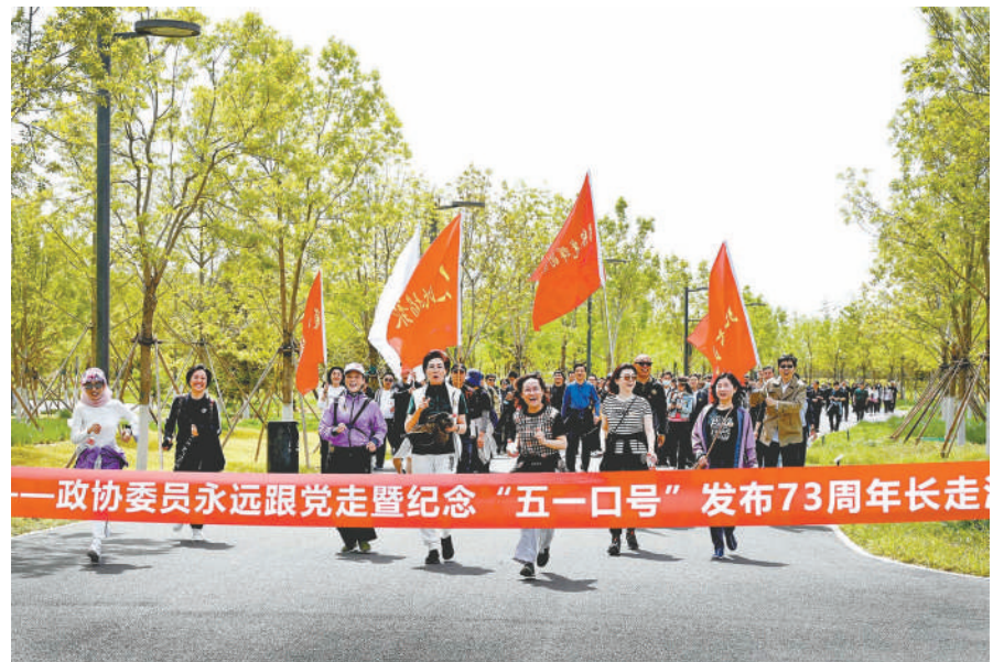
4月28日上午，北京市政协在通州区城市绿心森林公园举办“团结在光辉的旗帜下”——政协委员永远跟党走暨纪念“五一口号”发布73周年长走活动。