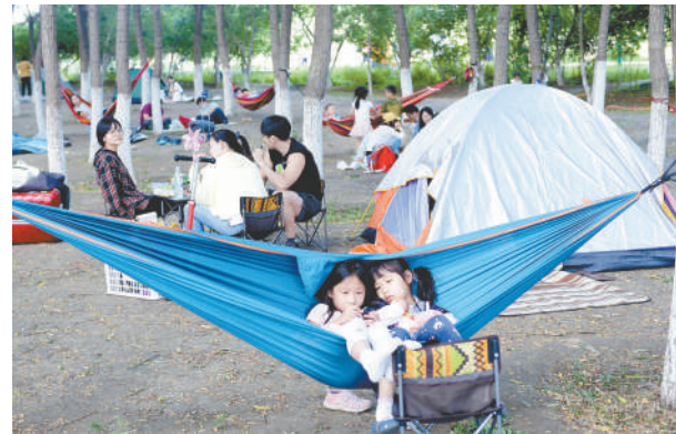
营地帐篷休闲区是个家庭休闲的好去处。

9月20日，北京环球影城主题公园开园，吸引了无数游客的目光。据测算，每年预计接待游客数量在1000万至1200万人次，年度营业额将超100亿元。