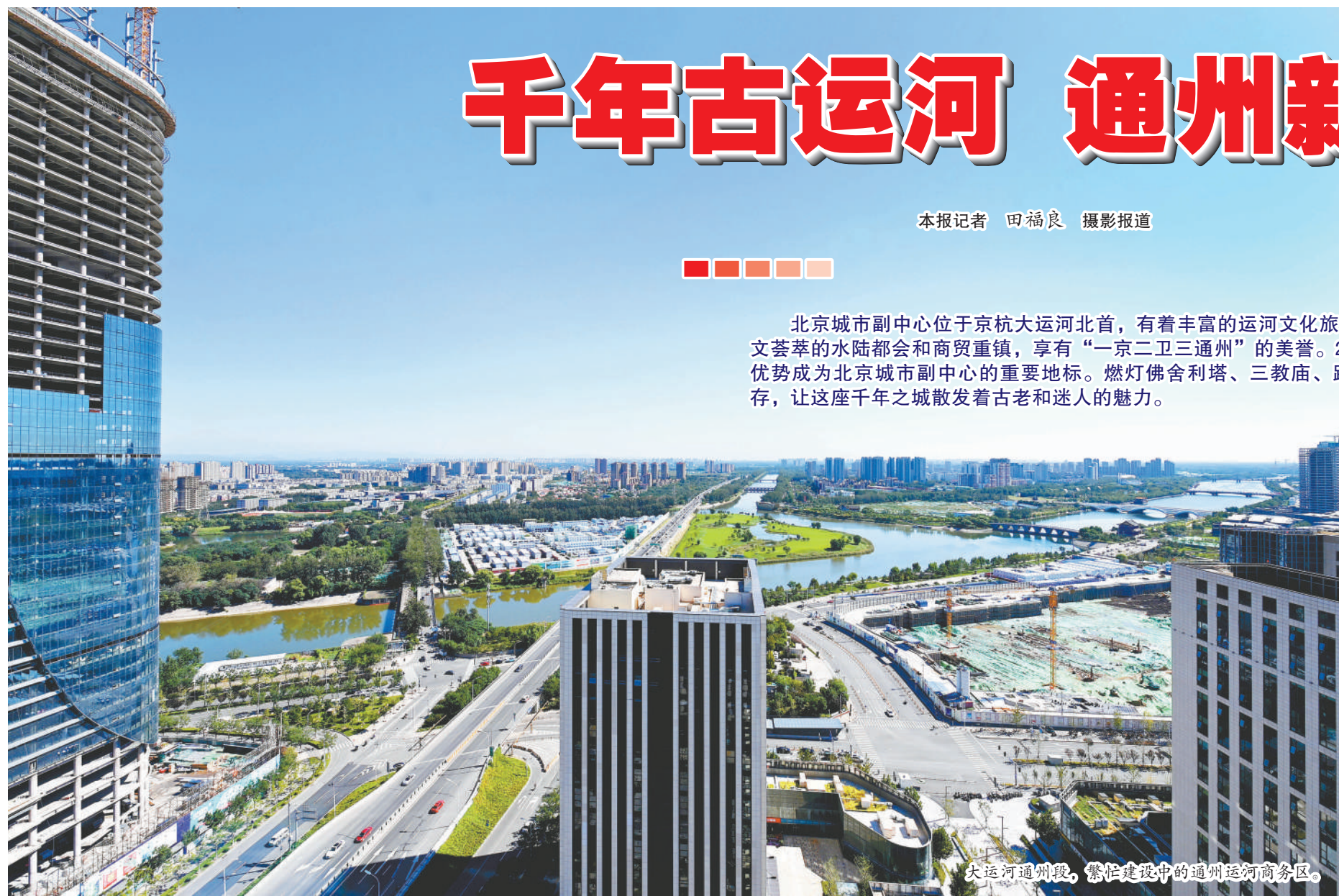
大运河通州段，繁忙建设中的通州运河商务区。

北京城市副中心位于京杭大运河北首，有着丰富的运河文化旅游资源。这里自古就是商贾云集、人文荟萃的水陆都会和商贸重镇，享有“一京二卫三通州”的美誉。2200多年的建置史，因其得天独厚的优势成为北京城市副中心的重要地标。燃灯佛舍利塔、三教庙、路县古城遗址等一大批历史古迹和遗存，让这座千年之城散发着古老和迷人的魅力。