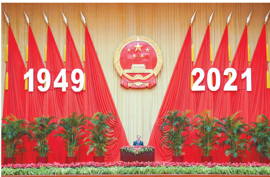
9月28日，全国政协办公厅、中共中央统战部、国务院侨办、国务院港澳办、国务院台办、中国侨联在北京人民大会堂联合举行国庆招待会，庆祝中华人民共和国成立72周年。中共中央政治局常委、全国政协主席汪洋出席并致辞。

汪洋指出，今年是中国共产党成立百年华诞，这在党和国家历史上、中华民族历史上都具有极其特殊的意义。习近平总书记在庆祝中国共产党成立100周年大会上发表重要讲话，全面回顾党的百年奋斗征程，鲜明提出伟大建党精神，深刻阐述以史为鉴、开创未来的根本要求，极大激发了全体中华儿女的壮志豪情。中国共产党是有理想有担当、有力量有本领、有自信有定力的政党，始终把人民放在心中的最高位置，始终把实现中华民族伟大复兴作为一切奋斗、一切牺牲、一切创造的主题。经过持续奋斗，我们胜利实现了第一个百年奋斗目标，正在意气风发向着第二个百年奋斗目标迈进，每一个中华儿女都有理由为之自豪。只要毫不动摇坚持党的领导，坚定不移走中国特色社会主义道路，紧紧依靠人民群众，加强中华儿女大团结，任何艰难险阻都阻挡不了中华民族迈向伟大复兴的铿锵步伐。