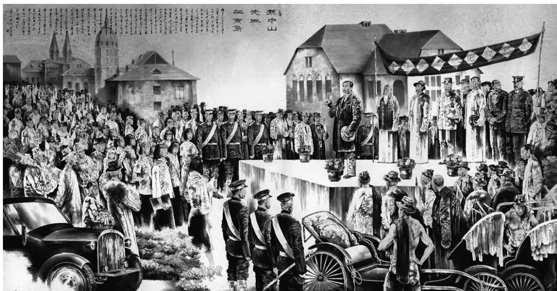
▲《孙中山先生在青岛》孔维克 作

当然,艺术创作不仅仅是创作者笔墨的锤炼和心境的抒发,还需包含艺术家的社会责任和担当。这种责任与担当不仅体现在艺术家要用手中的画笔来描绘时代图景、讴歌时代动人故事、撰写时代动人篇章,创造时代新的文化风采,还表现在艺术家要以实现中华民族伟大复兴为目标,以革命先辈为榜样,继承他们的遗志,坚定理想信念,把握正确方向,从历史中激发信仰,汲取奋进力量。