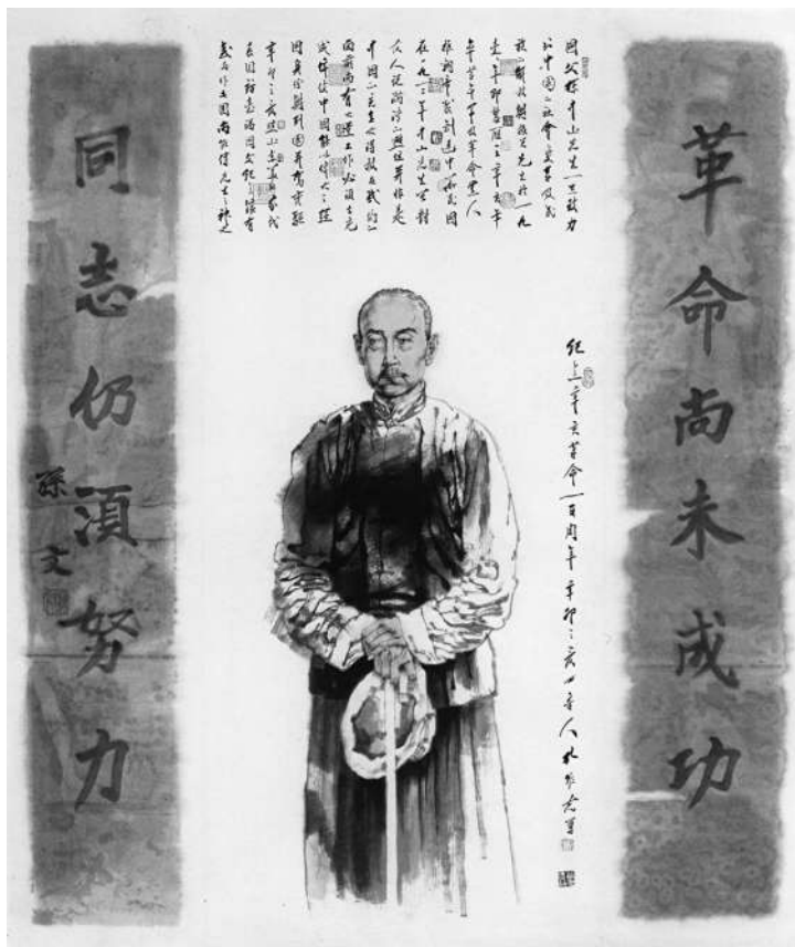
▲《同志仍须努力·为孙中山先生造像》孔维克 作

在进入展示孙中山生平的展厅后,我当时就被一件件文物级的信札、实物、照片等文献资料震撼了,看到那些珍贵的物件,顿有人去楼空、物是人非、沧桑悲壮之感,同时也感到它所承载的那份厚重的历史,以及折射出的那些动人心弦的时代风云变幻。尤其是见到了一件颇有匠心的文物陈列后,我受到了很大的启发,并深化了创作构思——我记得那是在展厅的最后一个橱窗,里面挂了一个衣服架子,架子上是孙中山先生生前穿过的上衣和裤子,虽然躯体不在了,但那套衣服却象征着开启世纪之门的伟人,依然默默地注视着现在的我们。在“衣架”的两边挂着他亲手撰写的一副对联,尽管破旧不堪、业已被如烟的岁月层层包裹,但那道劲而极富内涵的行楷大字还是留下了他临终前的悲愤、遗憾、勉励、希望等复杂的情绪,并且一直感染着今天的人们——那是我小的时候就听大人们传颂的孙中山先生的名言:“革命尚未成功,同志仍须努力”。这句话虽然早已耳熟能详,但从未像当时亲眼见到手书时那么激动、视觉及心灵的冲击力那么深刻。也许是那时那景之触动,也许是书法本身透出的感人力量,抑或有先生“衣冠冢”似的衣架布置所形成的一种独特气氛所致,当即我就拍下了一张照片。其实,在参观之前,我一直对装置艺术持否定态度,心想从杜尚的“小便器”直接搬入展厅起,西方的后现代就抛弃了绘画,开始了以装置艺术作为其艺术思想的载体,但那些装置艺术品,看后往往不知所云。然而,自那天看到孙中山先生的“衣架”后,有了一番顿悟,如把台搬进现代艺术的展厅,肯定会是一件感人至深的装置艺术品。受此“装置”的启发,我便设想,把衣架换成以水墨肖像来表现白发苍苍的晚年孙中山先生;他虽已年迈,但双眼依然炯炯有神,像我们常见照片中所熟悉的那样,充满了忧患意识和坚定信念。在