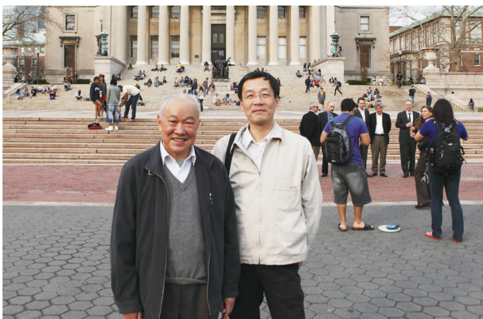
▲2010年汪朝光（右）与金冲及先生在美国哥伦比亚大学进行学术交流

以史为鉴，开创未来。今年是辛亥革命110周年。中国社会科学院世界史研究所原所长、研究员，中国孙中山研究会会长汪朝光，多年来致力于近代史、民国史与辛亥革命研究，参与主编《中华民国史》《中国近代通史》等多部重要论著。本期纪事邀请汪朝光结合习近平总书记纪念辛亥革命110周年大会上的讲话，讲述辛亥革命研究的经历与当代意义等。