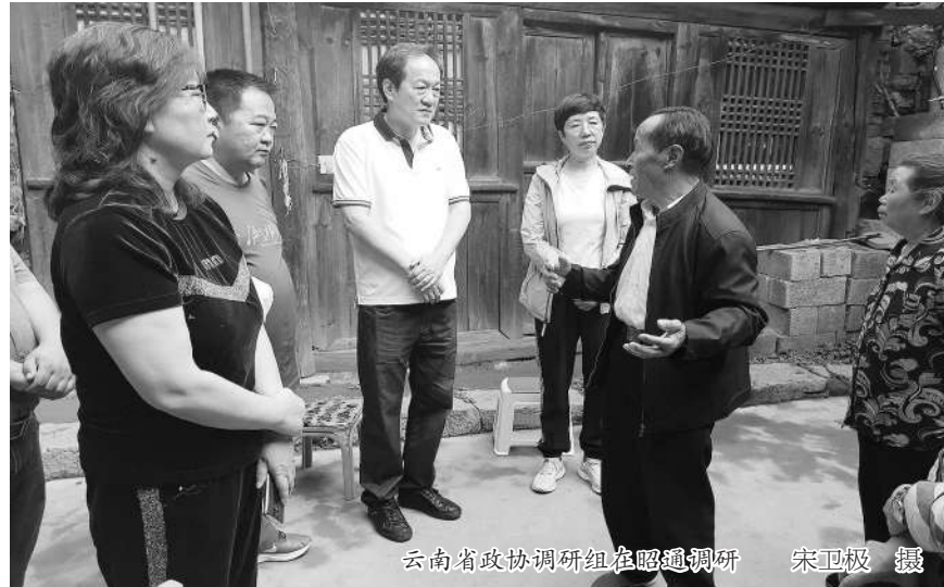
云南省政协调研组在昭通调研

省政协主席李江强调,要以更高的政治站位,围绕助推巩固拓展脱贫攻坚成果和全面实施乡村振兴战略深入调查研究,广泛协商议政,积极投身省政协“双向推”行动,不断作出政协新的更大贡献。