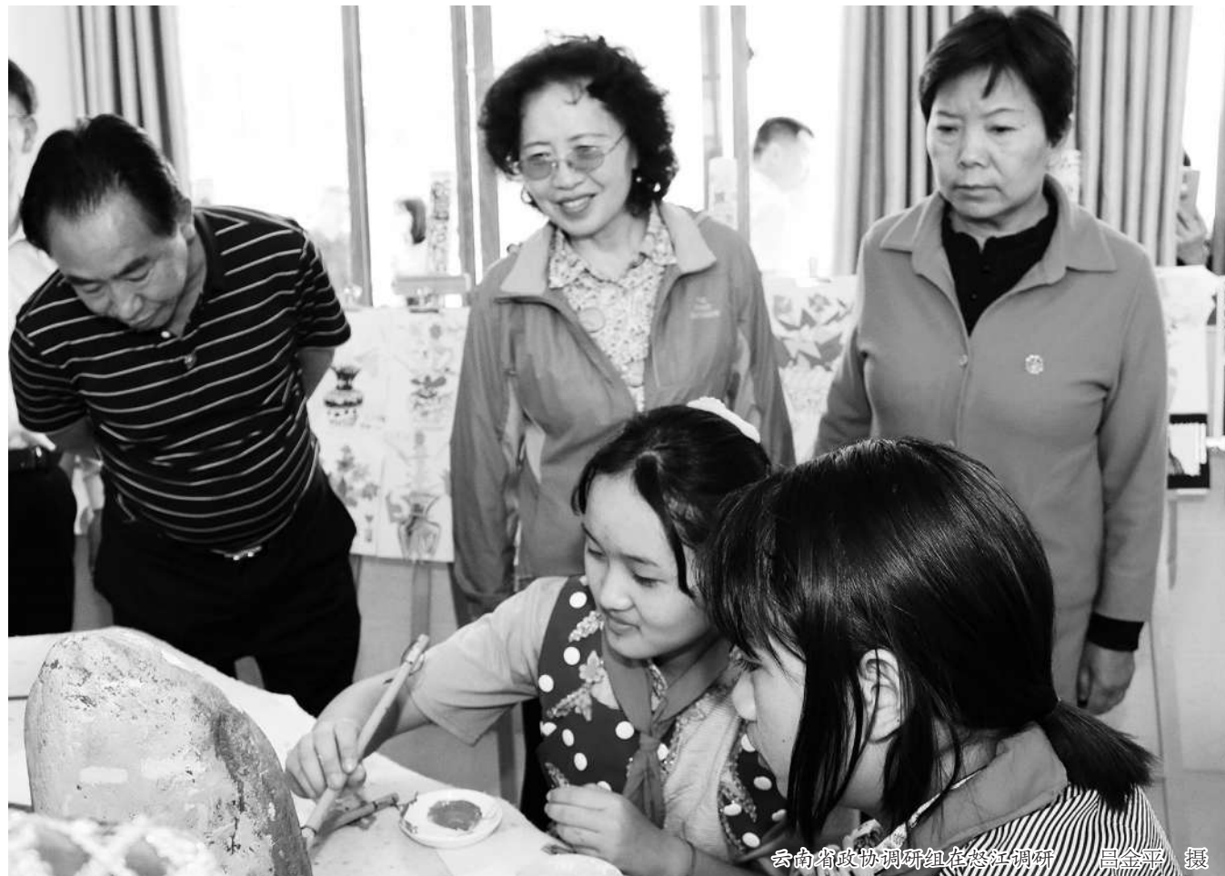
云南省政协调研组在楚雄调研