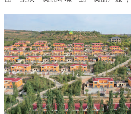
通过“村改社区”建设，榆阳区黄家圪崂村的群众搬进了红黄相间的二层小楼房。

近年来，榆林市榆阳区大力推进生态文明建设，发展全域旅游产业，探索出一条从“美丽环境”到“美丽产业”，再到“美丽经济”的“榆阳模式”。2020年国庆节前，占地37平方公里的麻黄梁黄土地质公园正式对外开放，如今已成为陕北乃至周边省市游客的网红打卡地。