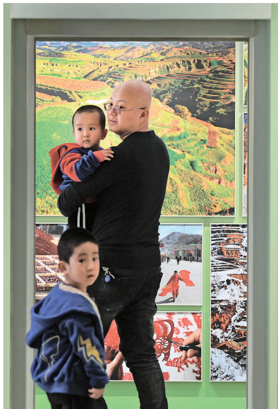
游客在郝家桥村史馆内参观，一幅幅照片讲述着郝家桥村的发展变迁。