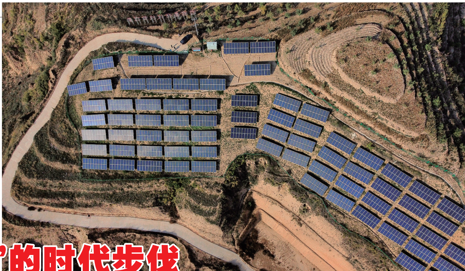
光伏发电成为该村壮大村集体经济的主要产业支撑