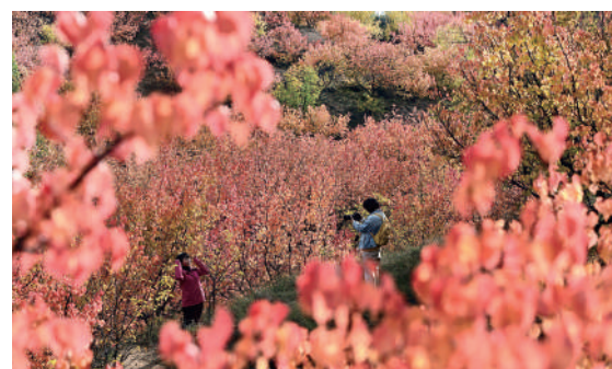
游客沉浸在古塔镇韩家梁村杏树岭万亩杏林的迷人风光中