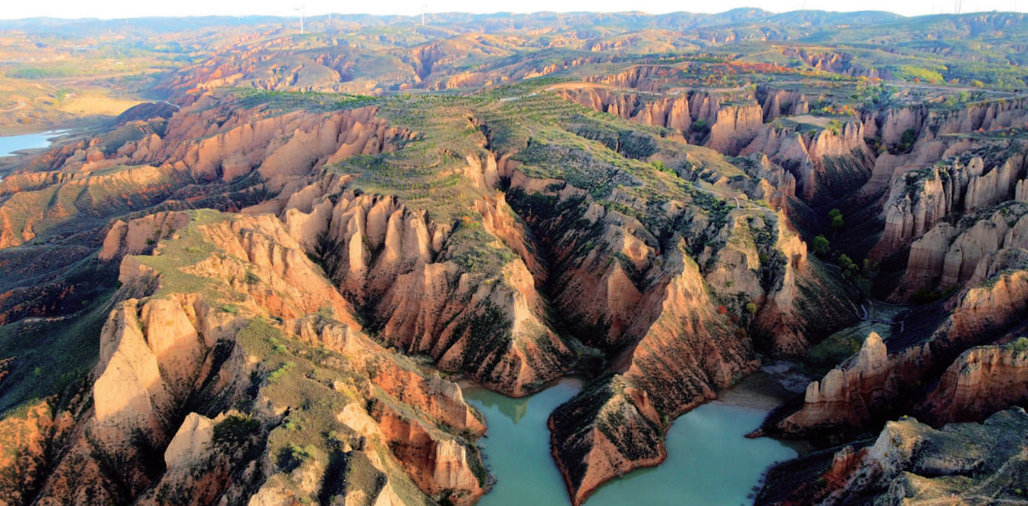
秋日的麻黄梁黄土地质公园