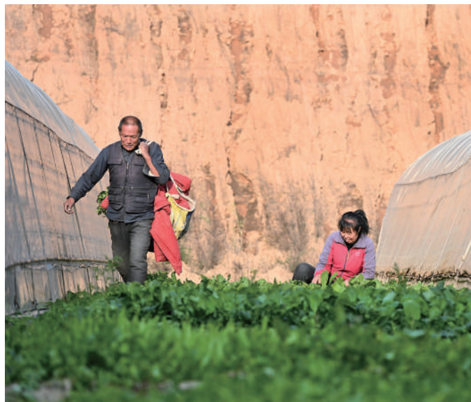
种植户在采收果蔬