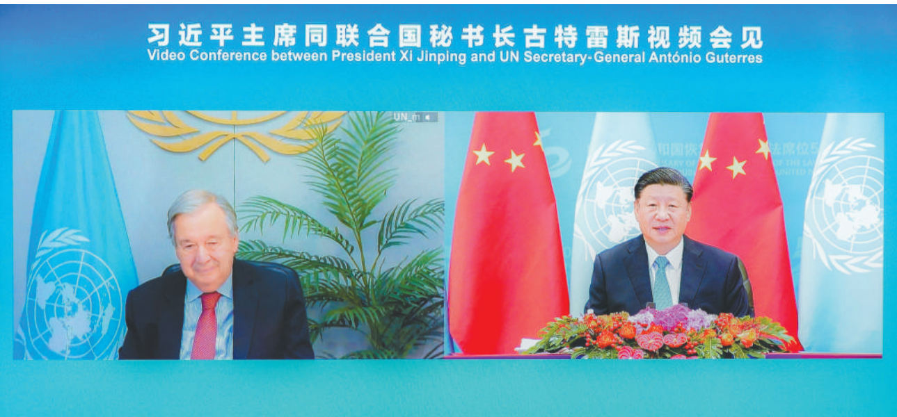
10月25日上午,国家主席习近平在北京人民大会堂以视频方式会见联合国秘书长古特雷斯。

新华社北京10月25日电 国家主席习近平25日上午在北京人民大会堂以视频方式会见联合国秘书长古特雷斯。