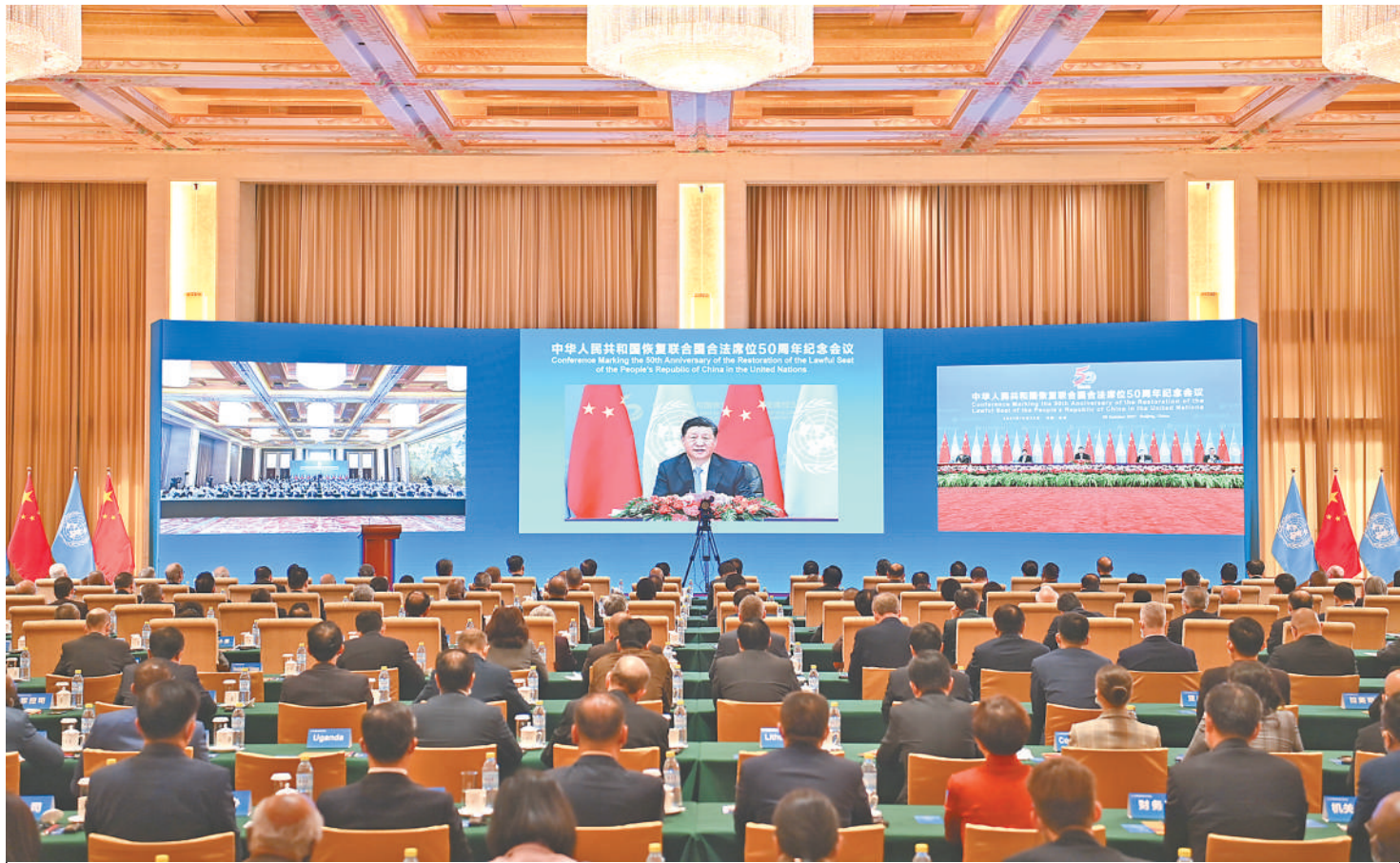
10月25日,国家主席习近平在北京出席中华人民共和国恢复联合国合法席位50周年纪念会议并发表重要讲话。

新华社北京10月25日电 国家主席习近平25日在北京出席中华人民共和国恢复联合国合法席位50周年纪念会议并发表重要讲话。习近平强调,新中国恢复在联合国合法席位以来的50年,是中国和平发展、造福人类的50年。中国将坚持走和平发展之路,始终做世界和平的建设者;坚持走改革开放之路,始终做全球发展的贡献者;坚持走多边主义之路,始终做国际秩序的维护者。中国愿同各国秉持共商共建共享理念,弘扬全人类共同价值,践行真正的多边主义,站在历史正确的一边,站在人类进步的一边,为实现世界永续和平发展、为推动构建人类命运共同体而不懈奋斗。(讲话全文见2版)