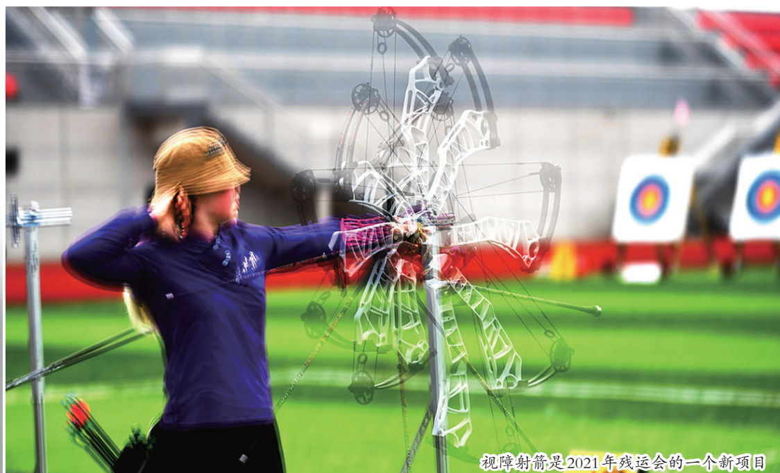
视障射箭是2021年残运会的一个新项目