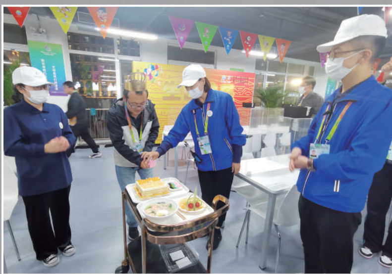
志愿者为来自北京的记者过生日送祝福