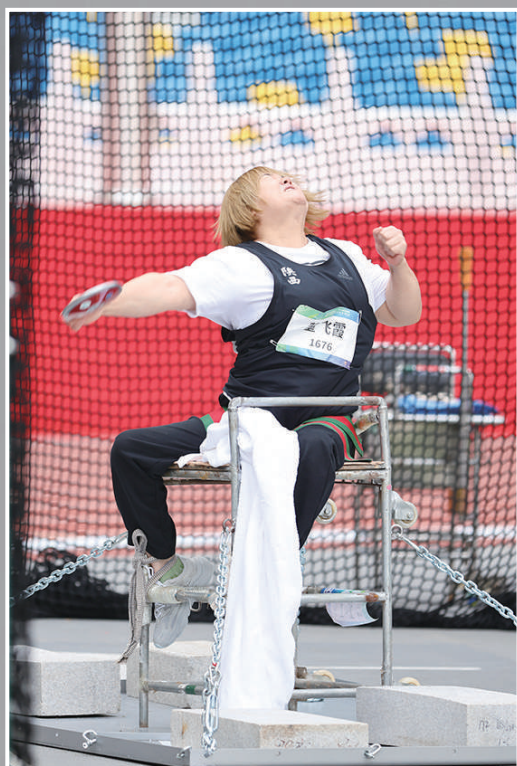
铁饼女子比赛现场