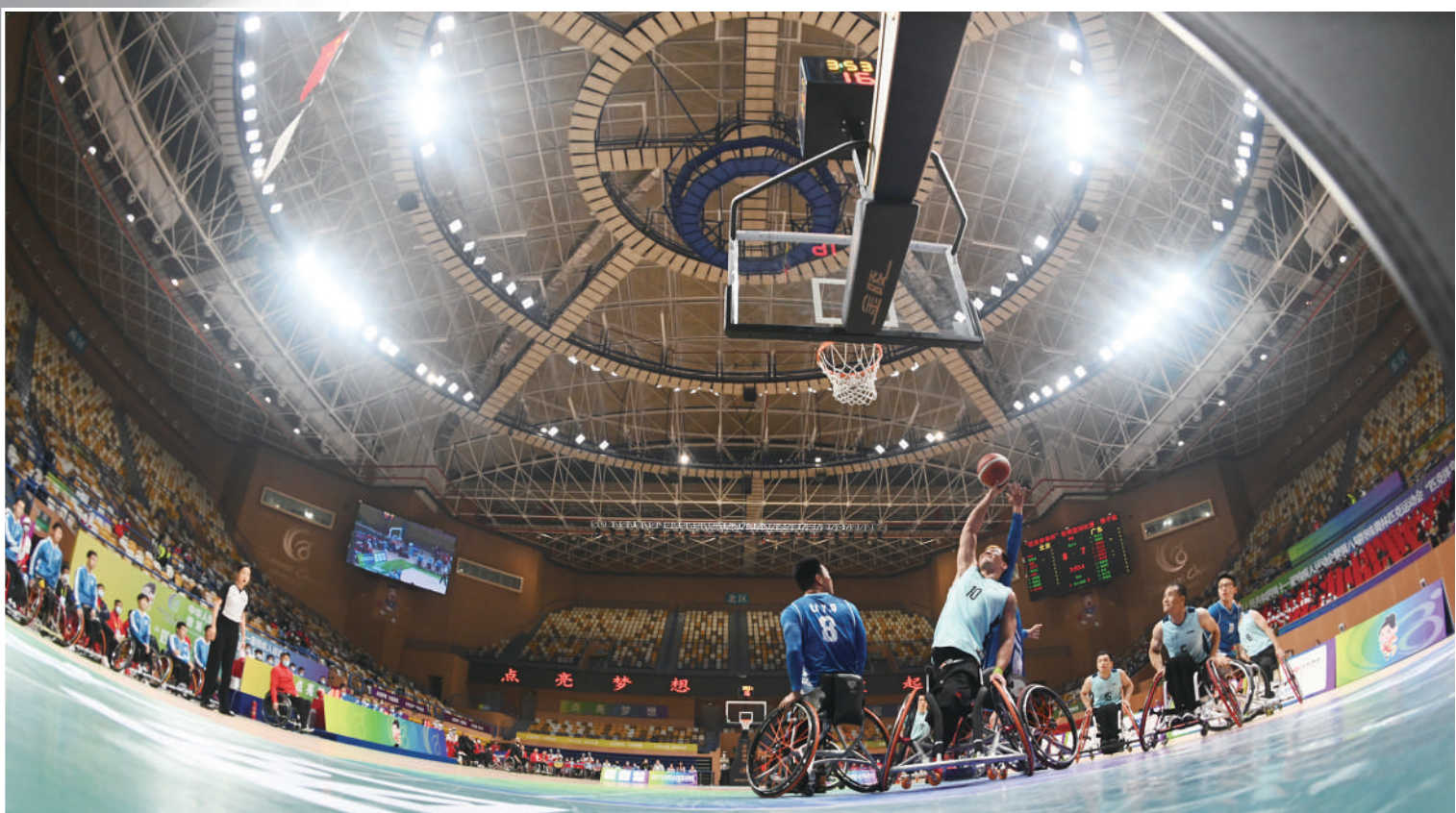
轮椅篮球男子组决赛中，北京队的小伙子们顽强比赛。

本届残运会暨特奥会历史上首次与全国运动会同年、同地举办。来自各省、市、自治区、特别行政区及新疆生产建设兵团的4484名残特奥运动健儿，承载着全国8500万残疾人的希望，在“曲江流饮，灞柳风雪”的陕西，追逐他们超越自我、不畏困难的梦想，展示他们挑战强手、勇于拼搏的精神，书写新时代属于自己的美好篇章。