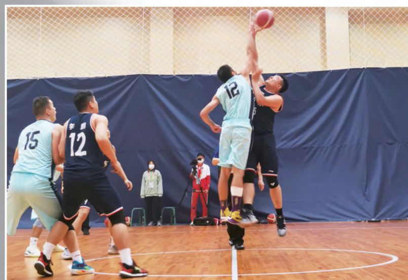
聋人篮球北京男队对阵山东男队