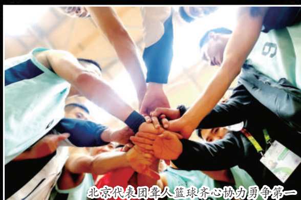
北京代表团聋人篮球齐心协力勇争第一