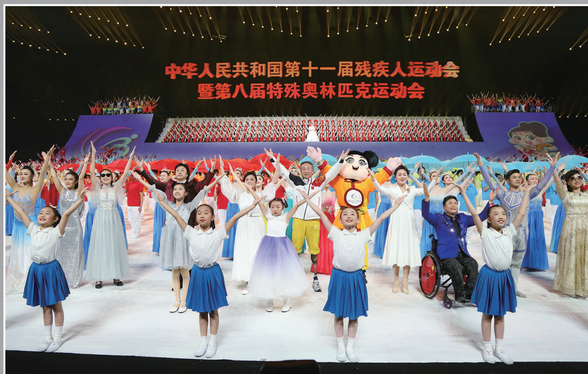
开幕式上运动员们欢聚一堂