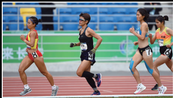
田径比赛女子10000米听障T60决赛中