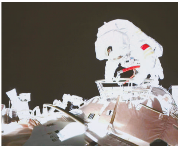
神舟十三号航天员王亚平出舱画面

据中国载人航天工程办公室消息，北京时间2021年11月7日18时51分，航天员翟志刚成功开启天和核心舱节点舱出舱舱门，截至20时28分，航天员翟志刚、王亚平身着我国新一代“飞天”舱外航天服，先后从天和核心舱节点舱成功出舱。