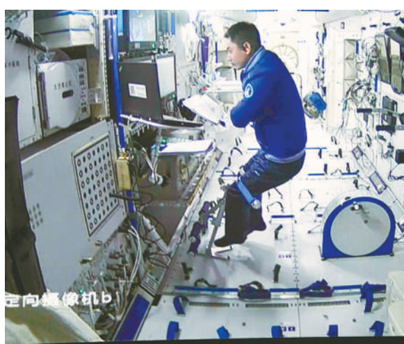
神舟十三号航天员叶光富在核心舱内工作