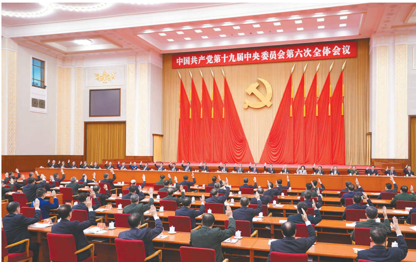
中国共产党第十九届中央委员会第六次全体会议,于2021年11月8日至11日在北京举行。中央政治局主持会议。新华社记者 燕雁 摄