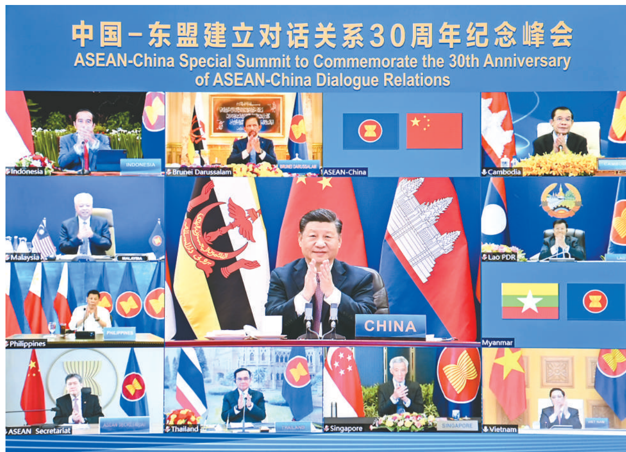
11月22日上午，国家主席习近平在北京以视频方式出席并主持中国—东盟建立对话关系30周年纪念峰会，发表题为《命运与共 共建家园》的重要讲话。中国东盟正式宣布建立中国东盟全面战略伙伴关系。

新华社北京11月22日电（记者 杨依军）国家主席习近平22日上午在北京以视频方式出席并主持中国—东盟建立对话关系30周年纪念峰会。中国东盟正式宣布建立中国东盟全面战略伙伴关系。习近平发表题为《命运与共 共建家园》的重要讲话。（讲话全文见2版）习近平指出，中国东盟建立对话关系30年来，走过了不平凡的历程。这30年，是经济全球化深入发展、国际格