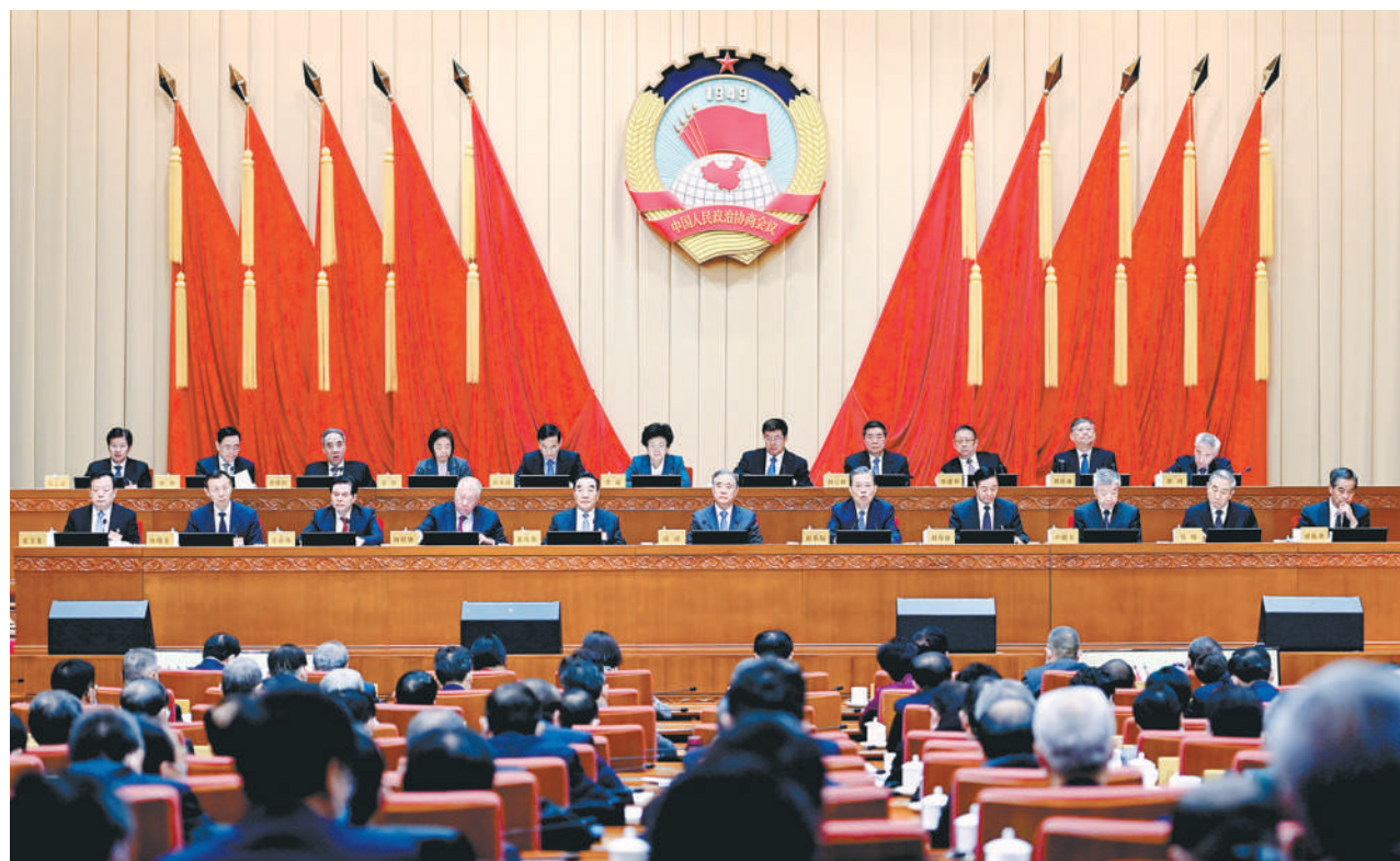
11月22日，政协第十三届全国委员会常务委员会第十九次会议在北京开幕，主要议题是学习贯彻中共十九届六中全会精神。中共中央政治局常委、全国政协主席汪洋主持开幕式。中共中央政治局常委、中央纪律检查委员会书记赵乐际应邀出席开幕式并作报告。

本报讯（记者 吕巍）政协第十三届全国委员会常务委员会第十九次会议11月22日在京开幕，主要议题是学习贯彻中共十九届六中全会精神。中共中央政治局常委、全国政协主席汪洋主持开幕式。中共中央政治局常委、中央纪律检查委员会书记赵乐际应邀出席开幕式并作报告。汪洋在主持讲话中指出，中共十九届六中全会全面总结中国共产党百年奋斗重大成就和历史经验，对于团结带领全党全国各族人民夺取新时代中国特色社会主义的伟大胜利，具有重大现实意义和深远历史意义，全会通过的《决议》是推动新时代党和国家事业发展的行动指南。深入学习贯彻六中全会精神是全国政协当前和今后一个时期的重大政治任务。常委会要自觉把思想和行动统一到全会精神上来，有效发挥人民政协作为国家治理体系重要组成部分和统一战线组织的作用，为实现中华民族伟大复兴的中国梦贡献智慧和力量。赵乐际介绍了召开中共十九届六中全会精神、《决议》起草过程和总体把握、《决议》基本框架和主要内容、学习贯彻全会精神有关要求，指出全会通过的《决议》具有重大深远意义，充分体现了以习近平同志为核心的中共中央把握历史规律、顺应发展大势的历史主动，必将有力推动全党进一步统一思想、统一意志、统一行动，以史为鉴、开创未来，埋头苦干、勇毅前行。赵乐际强调，要深入学习贯彻党百年奋斗的光辉历程、重大成就、历史意义、历史经验，深刻把握中国共产党为什么能、马克思主义为什么行、中国特色社会主义为什么好，深刻把握“确立习近平同志党中央的核心、全党