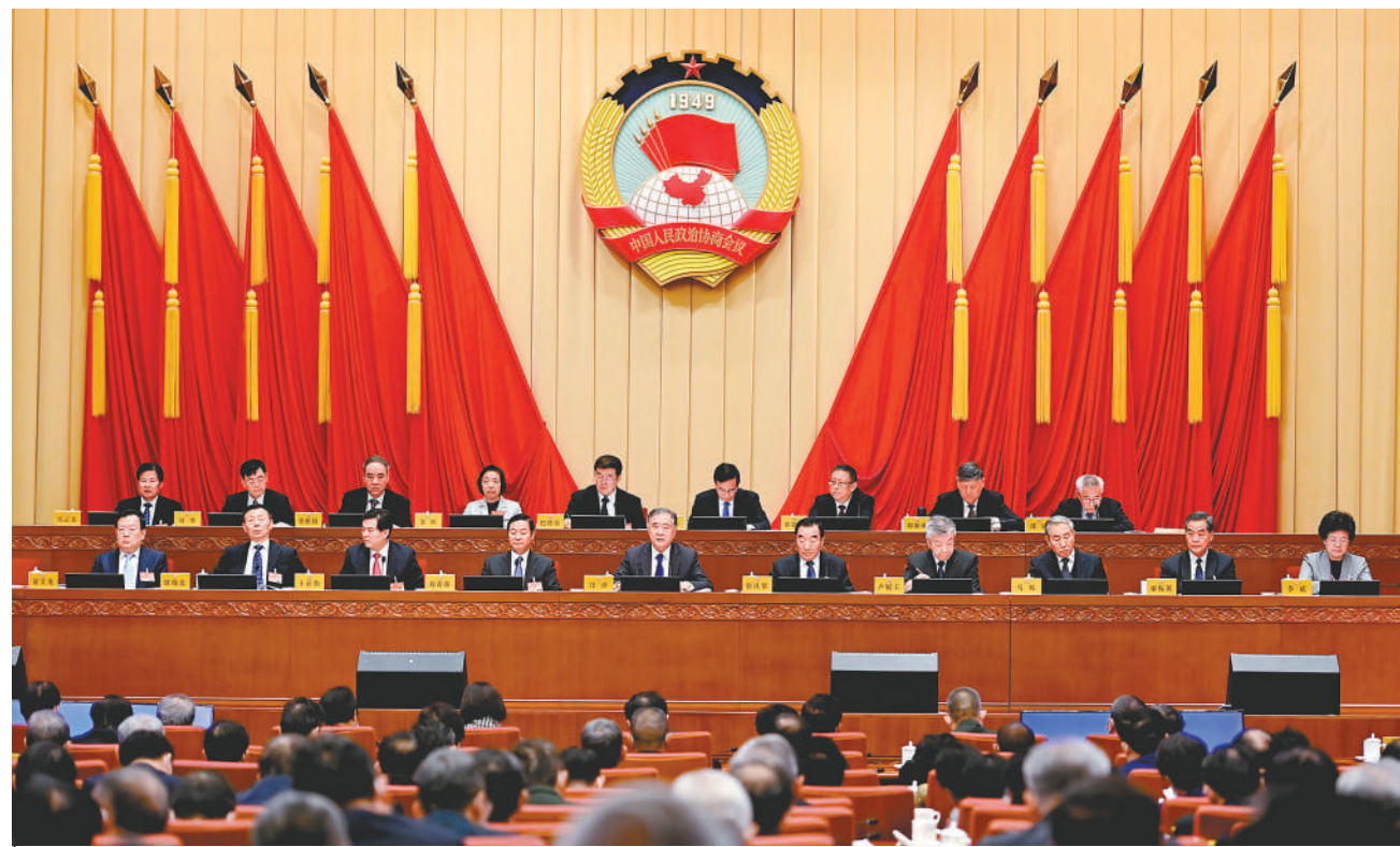
11月24日上午，政协第十三届全国委员会常务委员会第十九次会议在北京闭幕。中共中央政治局常委、全国政协主席汪洋主持会议并讲话。

本报北京11月24日电 政协第十三届全国委员会常务委员会第十九次会议11月24日上午在京闭幕。中共中央政治局常委、全国政协主席汪洋主持会议并讲话。