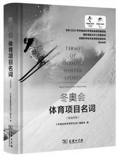
《冬奥会体育项目名词》

最大的冬奥多语种语库，共收录了13.2万个词条，包括中、法、英、俄、德、西、日、韩/朝八个语种对齐的核心竞赛术语7100余条。《冬奥会体育项目名词》是一本纸质词典，八个语种对齐的核心竞赛项目名词3000余条均源自术语平台。平台和词典主要为北京冬奥会的口笔译人员、志愿者、运动员、裁判员、新闻媒体工作人员等提供语言服务。不同语言的使用者可查阅词典，同时借助网站、手机应用、应用程序接口等渠道，搜索与冬奥会、冬残奥会相关的不同领域和门类的多语种语表、译文、解释、常见表达、使用场景和案例及出处，为测试赛和赛会各方提供优质跨语言服务。