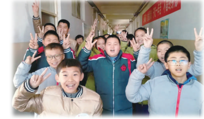
图为穿上捐赠羽绒服的孩子们

从发放冬衣到捐赠药品,从资助救援队到提供生计发展基金,记者从中国红十字基金会获悉,连日来,该基金会积极推进多个相关公益项目,全力帮助河南和山西等洪水受灾地区的灾后重建工作。