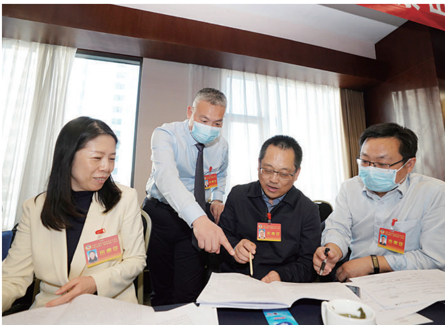
12月13日，北京市石景山区政协十一届一次会议开幕，在分组讨论和会议间歇，委员们畅所欲言借势冬奥，推动城市更新，使城市发展更多惠及百姓生活。