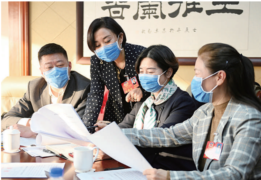
12月14日，北京市通州区政协七届一次会议开幕。图为分组讨论会后，委员们就共同关注的话题交换意见。