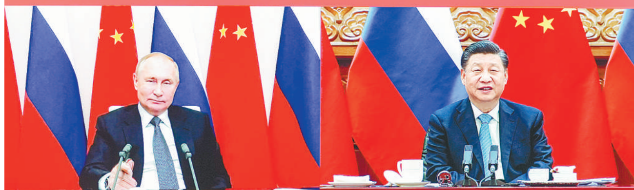
12月15日下午，国家主席习近平在北京同俄罗斯总统普京举行视频会晤。