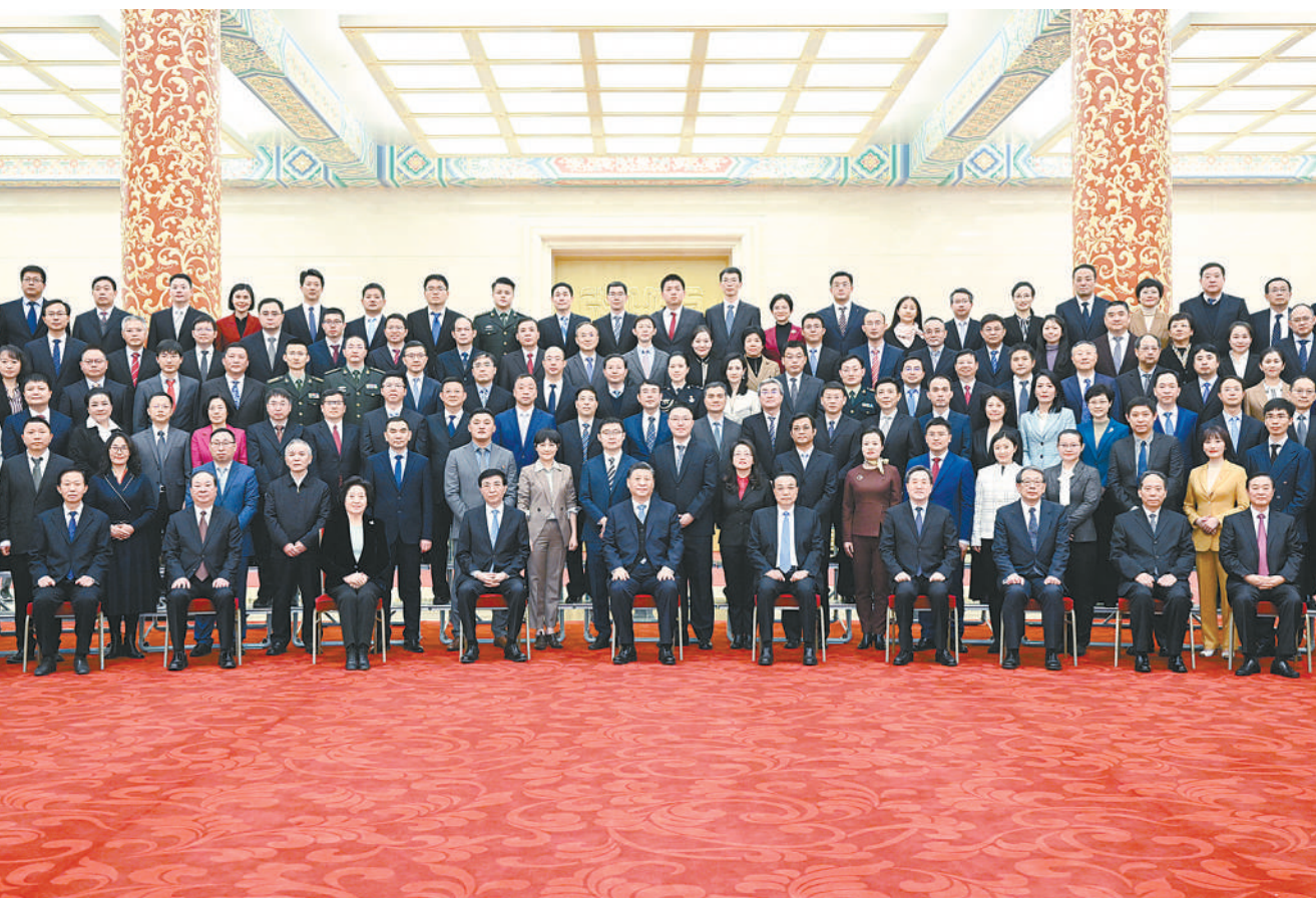
12月15日，党和国家领导人习近平、李克强、王沪宁等在北京人民大会堂会见中华全国新闻工作者协会第十届理事会第一次会议暨中国新闻奖颁奖会代表。

新华社北京12月15日电 中华全国新闻工作者协会第十届理事会第一次会议暨中国新闻奖颁奖会15日在京举行。中共中央总书记、国家主席、中央军委主席习近平在人民大会堂亲切会见会议代表，向他们表示诚挚问候和热烈祝贺。