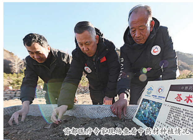
首都医疗专家现场查看中药材种植情况