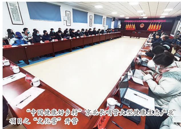
“中国健康好乡村”京北长哨营大型健康生态产业项目之“文化营”开营