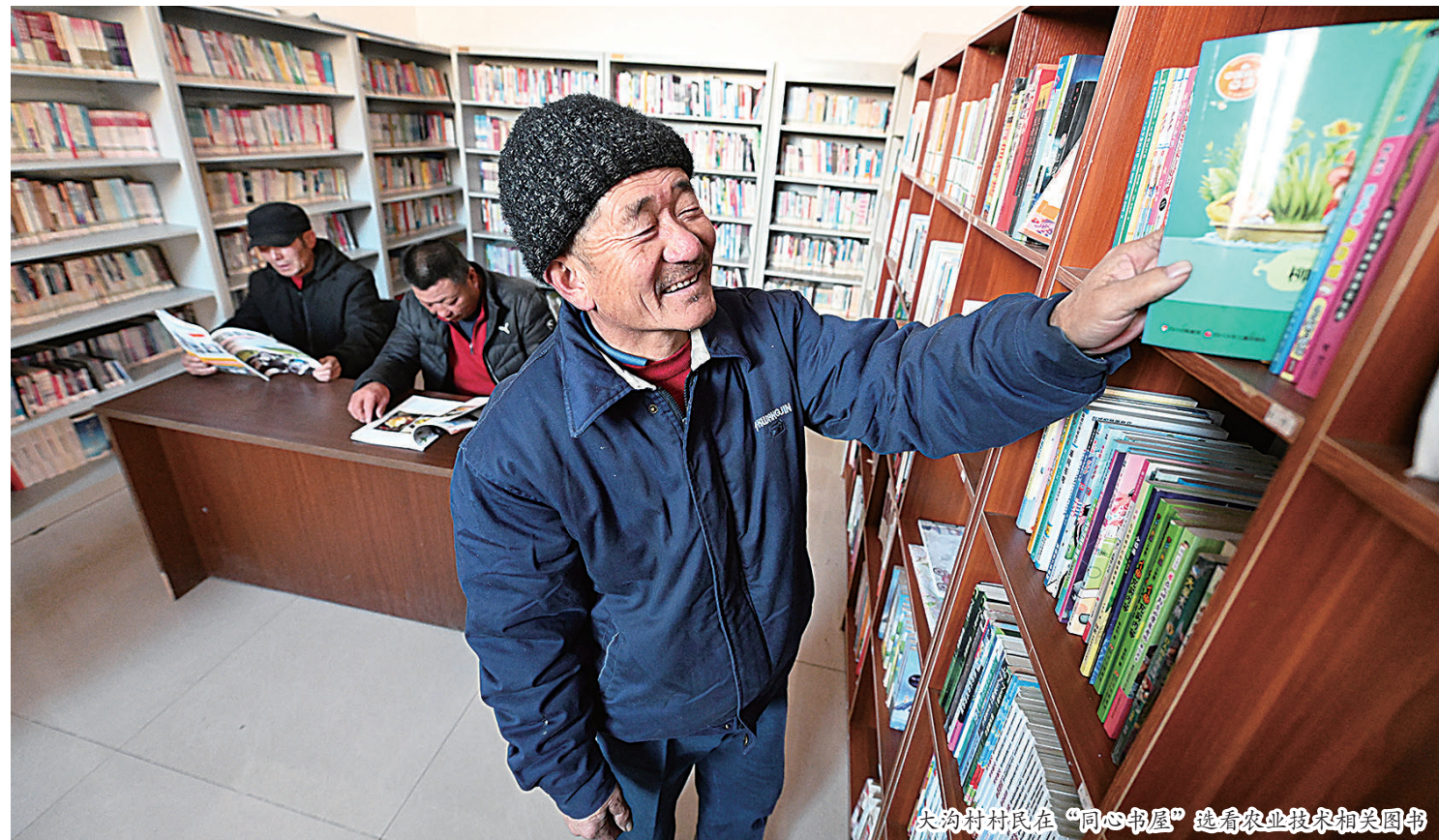
大沟村村民在“同心书屋”选看农业技术相关图书

日前，由中央统战部指导的“中国健康好乡村”京北长哨营大型健康生态产业项目之“文化营”开营仪式在北京市怀柔区长哨营满族乡大沟村启动。长哨营24个村落将率先通过“一村一俗”等文化项目建设，撬动包括道地中药材培育、产业深加工、经典医养等系统设施建设，带动当地产业发展为农民增收，助力乡村振兴整体发展。 “中国健康好乡村”项目在近6年的探索实践中，坚持以“一村一药、一村一品、一村一俗、一村一养”作为帮扶抓手，在受援地开展产业“特而强”、功能“聚而全”、形态“小而美”、机制“新而活”的健康帮扶创新工作，努力将经济欠发达、名不见经传的偏远乡村，建设成产业兴旺、康养宜居、乡风文明、生活富足的中国健康好乡村。目前，该项目已在黑河市新生鄂伦春族乡、安图县吉房子村、兴安县柞子坪村、婺源县溪头乡、迪庆州维西县等全国百余个乡村形成了独具特色的振兴帮扶新模式。（吴娜）