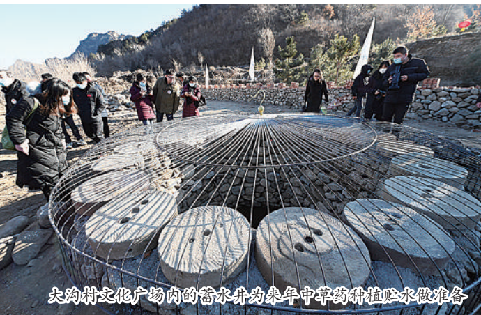
大沟村文化广场内的蓄水池为来年中草药种植蓄水做准备