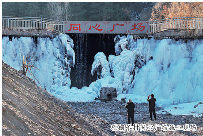
项柵子村同心广场施工现场