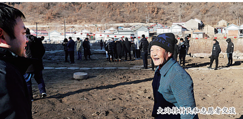
大沟村村民和志愿者交谈