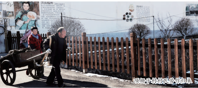
项柵子村村民劳作归来