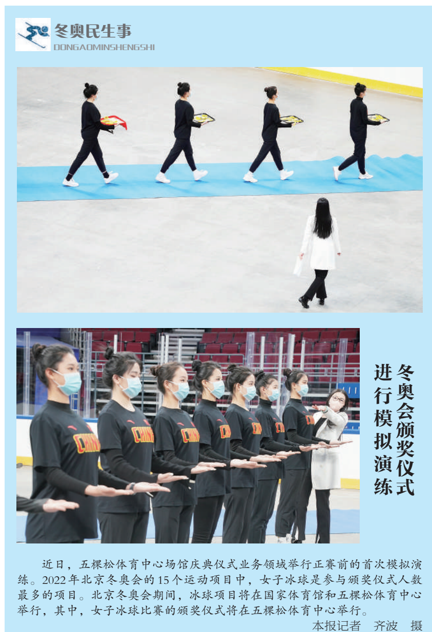
冬奥会颁奖仪式进行模拟演练

另外,尹成杰还提到,要以创新为动力,发展多元化、多样化、多层次的养老模式和业态。要开发丰富多彩的养老产品,不断地探索新形势下的养老产业模式和业态,发掘它的新内涵、新形式,从而通过发展养老事业和养老产业来带动经济发展。