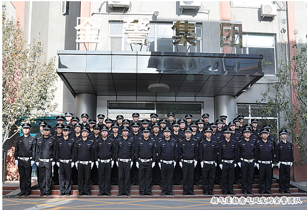
朝气蓬勃意气风发的金警团队