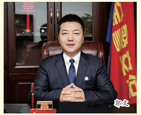
金警国际安保服务（北京）有限公司 党支部书记、董事长 北京市通州区第七届政协委员 北京市通州区第十二届工商联（商 会）副会长 北京市通州区慈善协会理事兼理事 龙商国际联盟副主席 北京黑龙江企业商会副会长