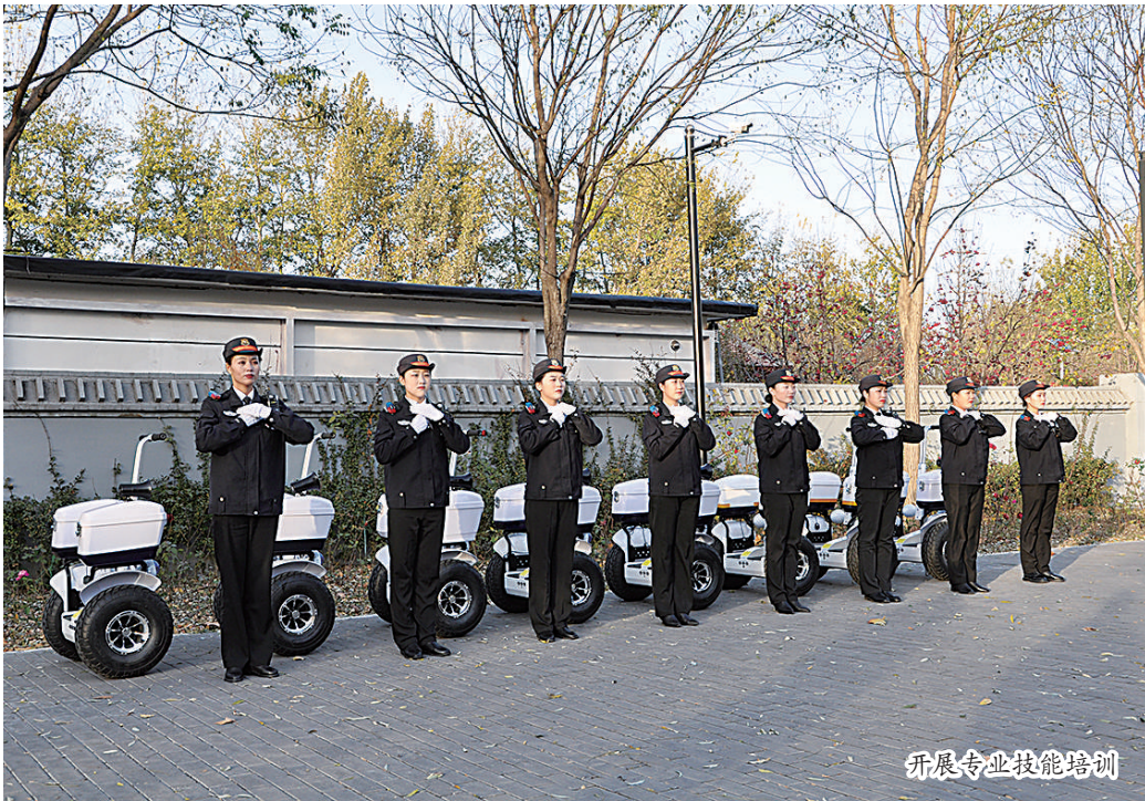
开展专业技能培训