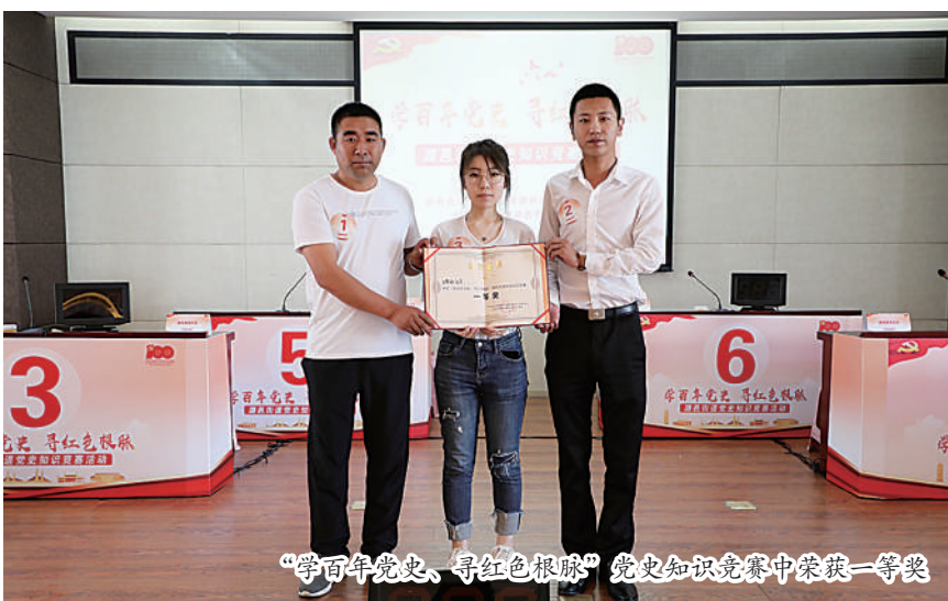
“学党史、寻红色根脉”党史知识竞赛中荣获一等奖

2019年9月20日，公司党支部组织开展了“党旗飘扬副中心、不忘初心践使命”主题党日活动。党支部组织党员根据自身工作特点，利用休息时间主动参与驻勤点区域内的交通疏导、捡拾垃圾、安全检查等各项志愿服务活动，强化使命担当。在大运河森林公园国庆游园活动进入倒计时之际，开展“忠诚奉献、决战决胜”70周年国庆安保主题党日活动，充分激发党员及志愿者对此次安保重任勇于担当的责任心和使命感。10月19日，党支部组织全体党员观看宣传教育片《我和我的祖国》，并赴卢沟桥中国人民抗日战争纪念馆开展“传承红色基因，接受红色洗礼”主题党日活动。通过瞻仰先烈事迹，感悟初心力量，共睹改革发展，践行使命担当。