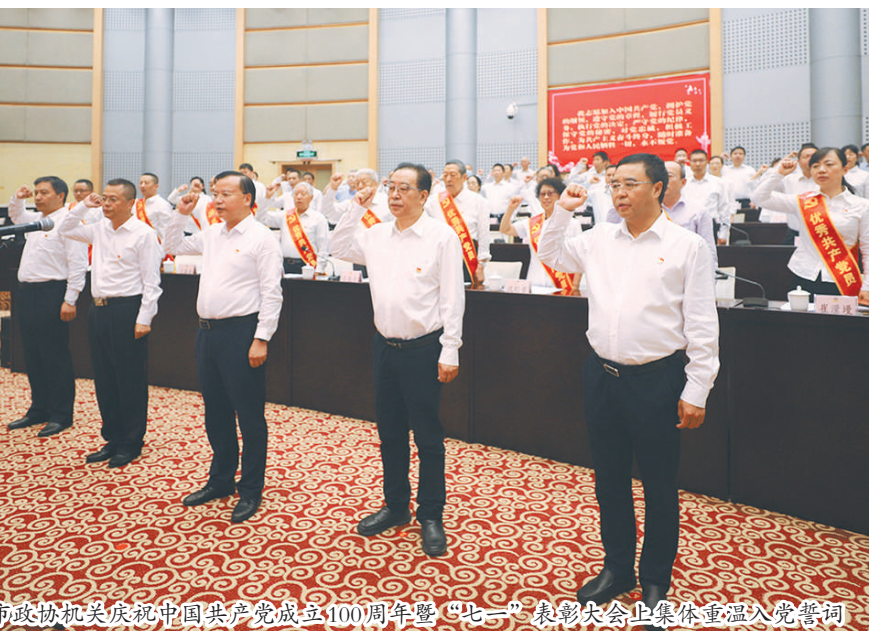
在市政协机关庆祝中国共产党成立100周年暨“七一”表彰大会上集体重温入党誓词

标准化、规范化党支部创建,开展“优秀共产党员”评选表彰,强化正面激励和引导。在全市市(镇、街道)成立137个“政协委员联络组”,由乡(镇、街道)党委书记或副书记担任组长。建立党员委员、常委年度述职机制,强化政治引领功能和表率示范作用发挥。新冠肺炎疫情发生后,党组第一时间发出倡议,广大党员身先士卒、率先垂范,各级政协委员积极响应、主动请缨,参与一线值守防控,积极建言献策,累计捐款捐物1200余万元。