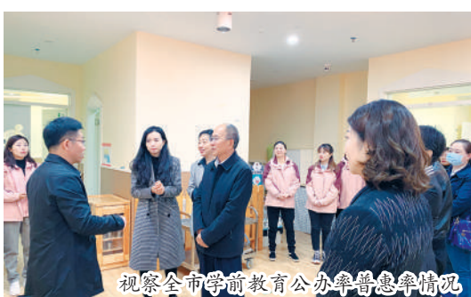
视察全市学前教育办园普惠率情况