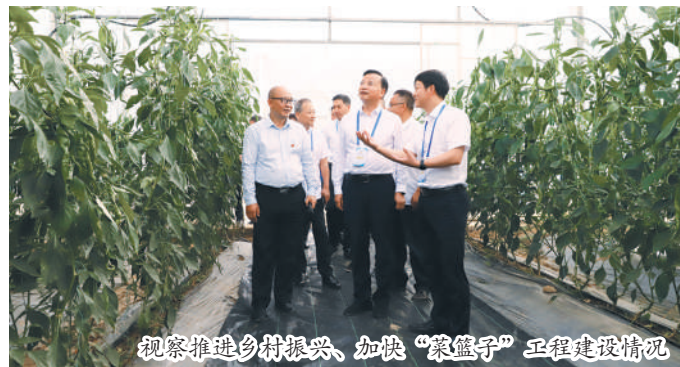
视察推进乡村振兴,加快“菜篮子”工程建设情况