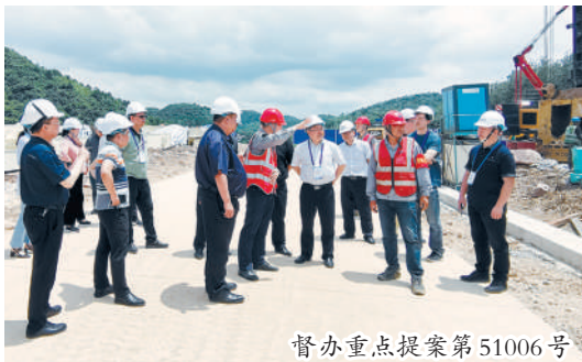
督办重点提案第51006号

回顾5年来的奋斗历程,我们深切感到,做好新时代贵阳政协工作,关键要做到“五个必须”。 必须对标核心,才能精准航向。 这些年来,正是由于我们毫不动摇坚持中国共产党的领导,坚定自觉向习近平总书记看齐,衷心拥护“两个确立”,切实履行“两个维护”,认真贯彻落实中共中央、贵州省委、贵阳市委决策部署和对政协工作的要求,才确保了全市政协事业沿着正确的政治方向昂首阔步、笃定前行。