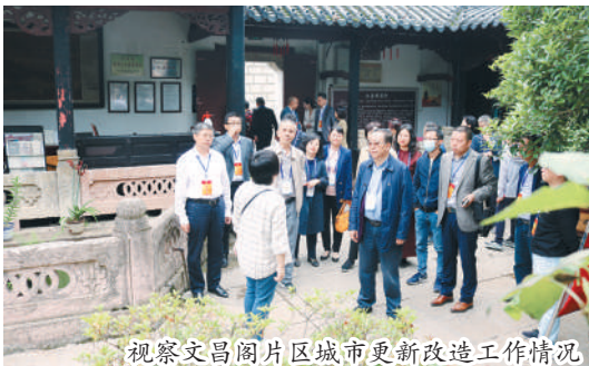
视察文昌阁片区城市更新改造工作情况