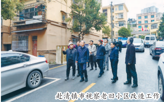
赴清镇市视察老旧小区改造工作

必须守正创新,才能焕发活力。 这些年来,正是由于我们顺应时代要求和委员期待,坚持在继承中发展、在实践中探索、在创新中突破,不断推出委员进社区、协商进基层、跨区域协商等新平台、新举措,切实做到“政协搭台、委员唱戏”,才使得贵阳市政协事业实现新发展、展现新气象!