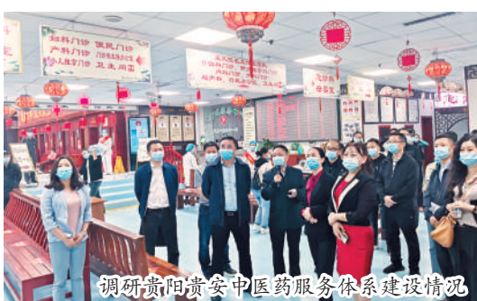
调研贵阳贵安中医药服务体系建设情况

贵阳市政协始终把调查研究作为履职的重要抓手,以“三抓”深入开展调研,形成了一批立意深、质量高、针对性强的调研成果,以高质量建言助力高质量发展。