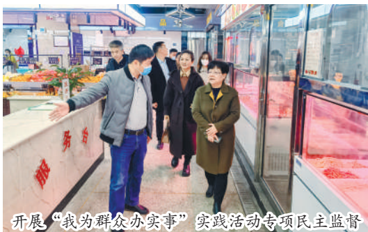
开展“我为群众办实事”实践活动专项民主监督