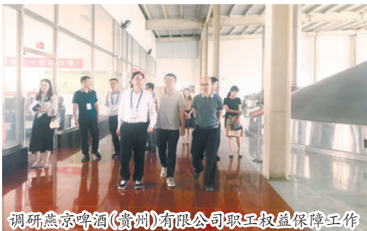
调研燕京啤酒(贵州)有限公司职工权益保障工作