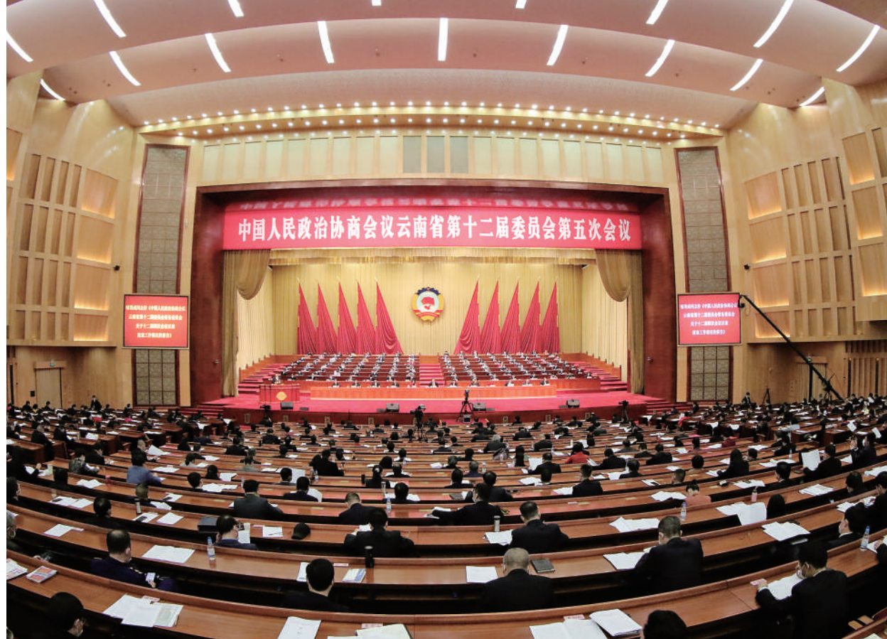
1月19日，云南省政协十二届五次次会议在昆明开幕，图为开幕大会现场。

本报讯 1月19日上午，中国人民政治协商会议云南省第十二届委员会第五次会议在昆明云南会馆隆重开幕。 中共云南省委书记王宁，中共云南省委副书记、省长王予波，全国人大常委会副主任委员陈豪，全国政协民族和宗教委员会副主任罗正富，省委副书记石玉钢等到会祝贺，并在主席台就座。 大会执行主席李江、杨嘉武、高峰、喻顶成、董华、陈玉侯、徐彬、何波、童志云、张荣明在主席台前排就座。 上午9时，大会开幕，全体人员起立，奏唱中华人民共和国国歌。 本次会议应到委员605名，实到535名，符合规定人数。 会议首先审议通过了政协云南省第十二届委员会第五次会议议程。 王宁代表中共云南省委对大会的召开表示热烈祝贺，对全省各级政协组织和广大政协委员在过去一年中为全省经济社会发展作出的贡献给予肯定。他指出，