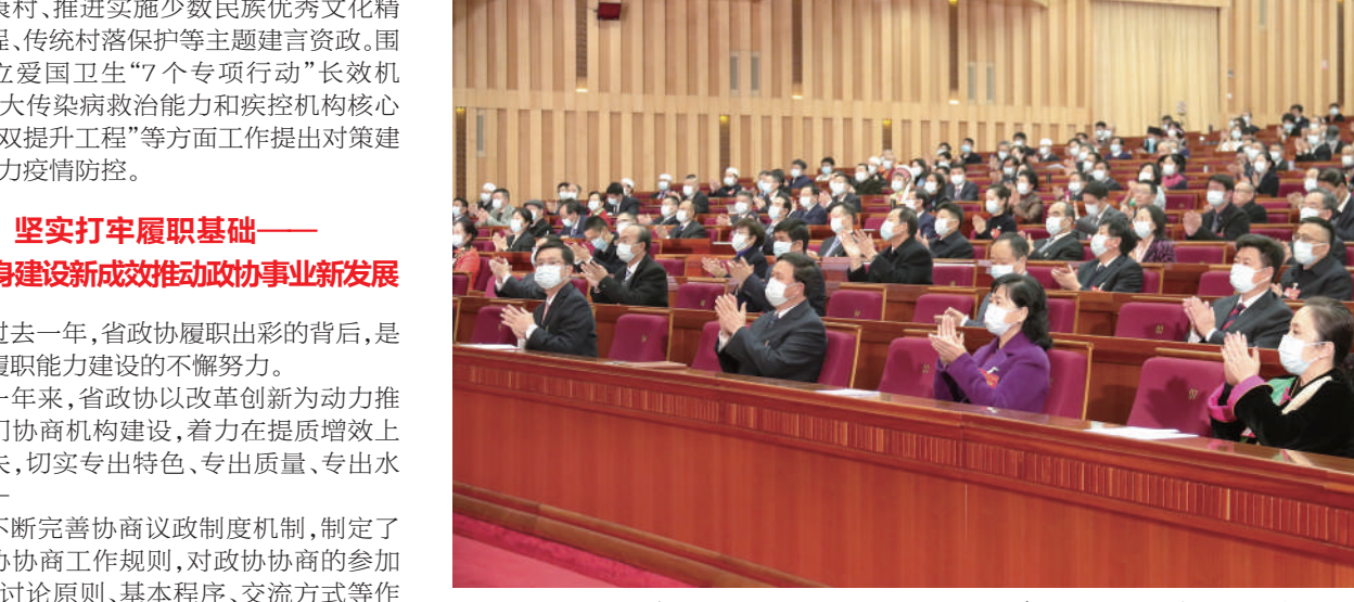
1月19日，在云南省政协十二届五次次会议开幕大会现场，委员们认真聆听。