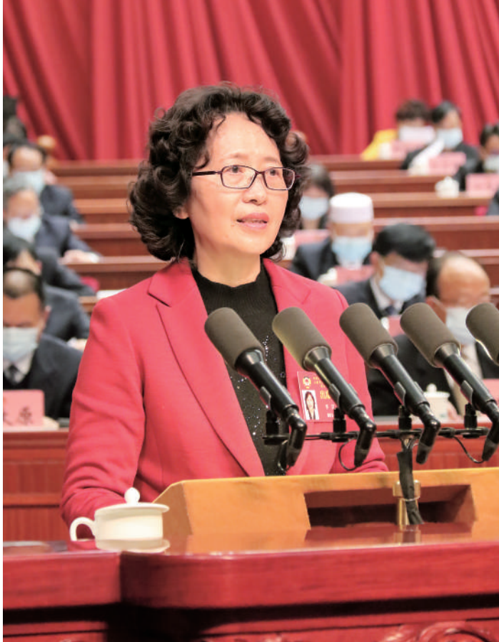
云南省政协主席李江作常委会工作报告