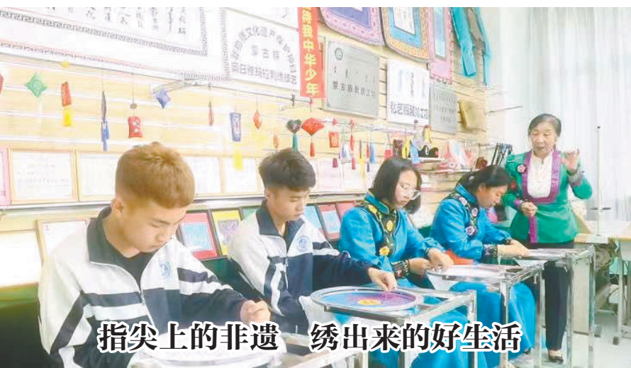
指尖上的非遗 绣出来的好生活

在内蒙古科尔沁蒙古族部落柏氏族,传承着一项特别的刺绣技艺,奥日雅玛拉刺绣(汉语为“鬃绣”)又叫“卷羊毛绣”,是一种立体感强、美观大气而且结实耐用的刺绣方法。