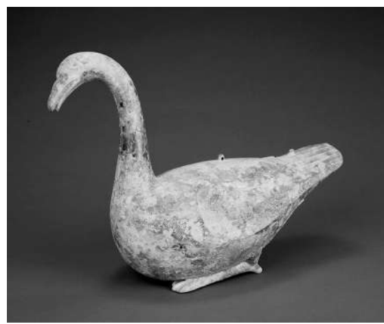
青铜雁形尊(重庆中国三峡博物馆藏)

本报讯(记者 付裕)重庆中国三峡博物馆藏西汉青铜雁形尊等珍贵文物,正在中国国家博物馆和中国长江三峡集团有限公司联合主办的“江天万里——长江文化展”中展览,这只青铜雁形尊为一只伏卧的大雁,长颈高昂,雁头微垂,展现着优美的线条和怡然的神情。与此同时展出的,还有《乾隆十六年南巡各地详图》《滇南盐井图》等古代绘画作品。