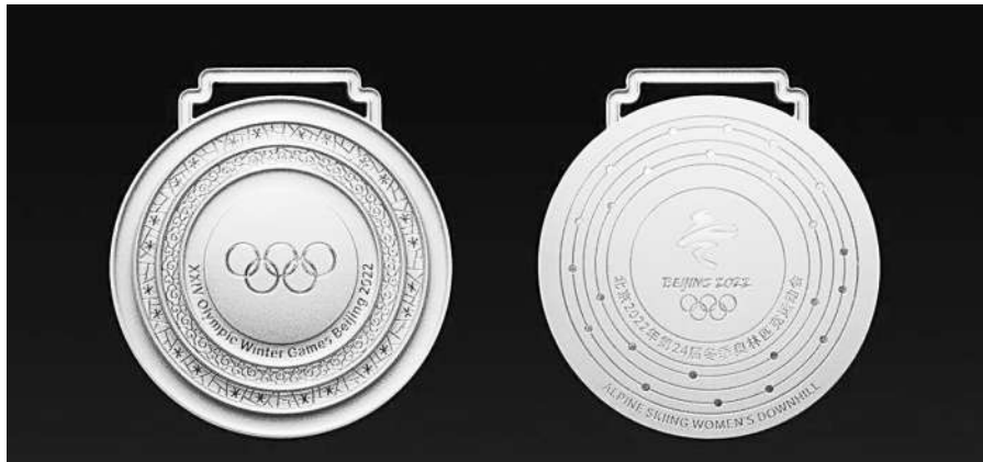
北京2022年冬奥会奖牌正面背面

北京2022年冬奥会开幕在即。日前,记者随北京市文旅局走进北京冬奥村,在广场区的“文化中国”展厅看到了与冬奥会相关的非遗、文创产品。其中,火种台、火种灯及奖牌的设计理念备受关注,它们源自几件国宝级的文物藏品,吸引大家纷纷驻足详细了解。