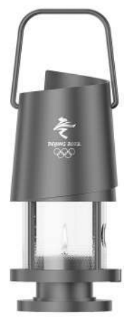
北京冬奥会火炬接力火种灯

长信宫灯最绝妙的设计便是它蕴含的环保理念。由于古代灯具常用动物油脂作为燃料,燃烧时形成的烟尘弥漫扩散,会散发出刺鼻的气味。长信宫灯在使用时,呛鼻的烟尘能够随着热空气的推动徐徐上升,沿官女的袖管不断进入中空的灯体