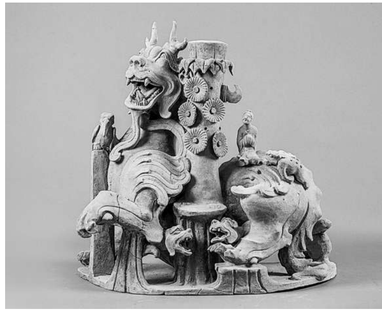
陶摇钱树座(重庆市文物考古研究院藏)