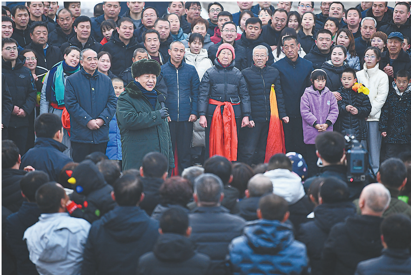
1月26日至27日，中共中央总书记、国家主席、中央军委主席习近平来到山西，看望慰问基层干部群众。这是26日下午，习近平在临汾市汾西县僧念镇段村文化广场，给乡亲们拜年，向全国各族人民、向港澳台同胞和海外侨胞致以美好的新春祝福。