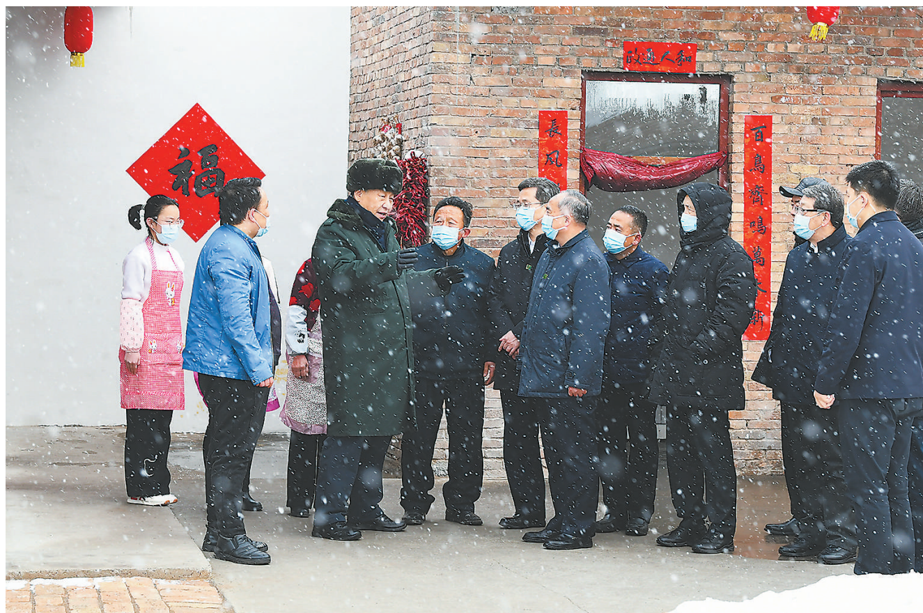
1月26日至27日，中共中央总书记、国家主席、中央军委主席习近平来到山西，看望慰问基层干部群众。这是26日下午，习近平在临汾市霍州市师庄乡冯南垣村受灾村民师红兵家看望。

新华社太原1月27日电 中华民族传统节日春节即将到来之际，中共中央总书记、国家主席、中央军委主席习近平来到山西，看望慰问基层干部群众，向全国各族人民、向港澳台同胞和海外侨胞致以美好的新春祝福，祝福大家身体健康、工作顺利、阖家幸福、虎年吉祥！祝愿伟大祖国山河锦绣、风调雨顺、国泰民安、繁荣富强！