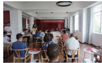
普洱市政协联合思茅区政协开展“城市社区物业管理工作”基层协商。

如今，普洱市委全面深化改革委员会已将全市政协系统开展“协商在基层”工作列为全市重点深化改革试点任务之一。下一步，普洱市政协将贯彻落实好全省政协系统全面推进“协商在基层”工作会议精神，持续探索创造政协协商向基层延伸、与基层协商有效衔接、服务边疆民族地区社会治理与基层社会治理的“普洱经验”，打响“协商在基层”的特色履职品牌。