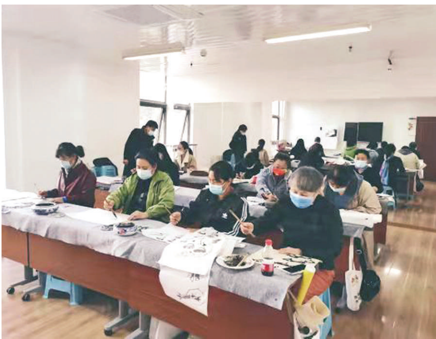
全国政协文化文史和学习委员会、民进中央考察组赴北京市门头沟区实地考察基层公共文化服务中心