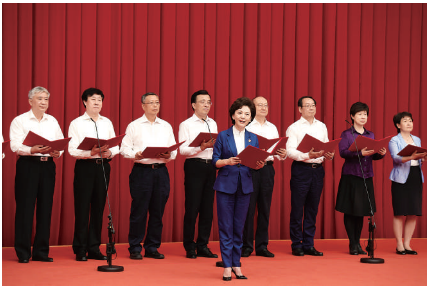
全国政协委员读书活动举办“品读红色经典 汲取奋进力量”线下讲读会

委员们在调研中感受到,一些转型改制后的出版单位,通过融合正在快速发展,甚至成为当地或行业内的标杆。而且,图书不同于一般的商品,它在塑造人们思想、影响社会风气和培育民族精神方面起着重要作用,因此,出版业的高质量发展,关系到人们思想、精神层面