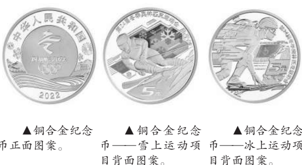
▲铜合金纪念币——雪上运动项目背面图案。 ▲铜合金纪念币——冰上运动项目背面图案。（整理/付裕）

冬奥会纪念币正面主景图案均为第24届冬季奥林匹克运动会会徽，辅以图案化的北京冬奥会比赛场馆、长城、雪山等元素。冰上运动项目背面主景图案为短道速滑运动员形象，背景为抽象化的线条等组合元素，并刊“第24届冬季奥林匹克运动会”字样及面额。雪上运动项目背面主景图案为高山滑雪运动员形象，背景图案为高山、雪花，局部为彩色图案，并刊“第24届冬季奥林匹克运动会”字样及面额。