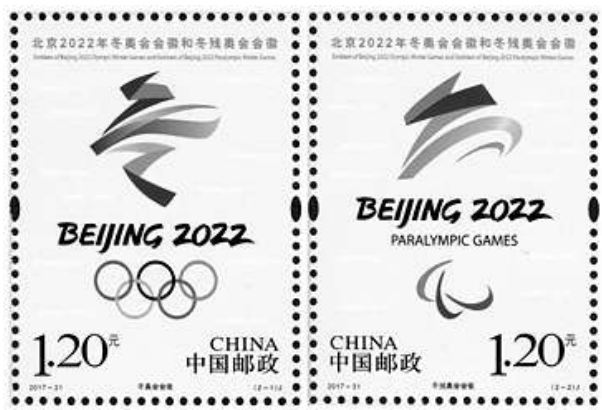
▲2017-31《北京2022年冬奥会会徽和冬残奥会会徽》纪念邮票

北京冬奥会恰逢中国农历春节，中国文化元素与冬奥会联袂呈现出令人惊喜赞叹的绚丽色彩。赛场内外，展现出一个个精彩的瞬间，一幕幕动人的场景。