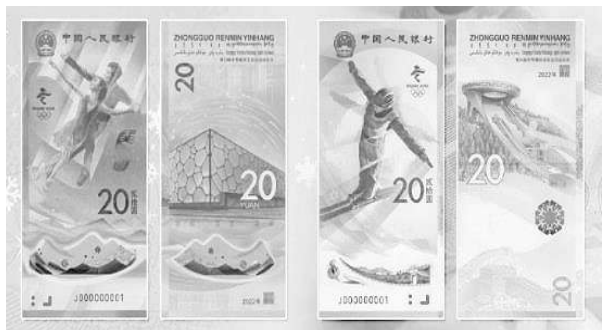
▲第24届冬季奥林匹克运动会纪念钞

除冬奥相关邮票外，冬奥纪念币、纪念钞也同样深受欢迎。据了解，第24届冬季奥林匹克运动会纪念钞一套两张，每套包括冰上运动项目纪念钞和雪上运动项目纪念钞各1张，面额均为20元。此次发行的冰上运动项目纪念钞为塑料钞。冰上运动项目纪念钞正面主景为花样滑冰运动员图案，背面主景为第24届冬季奥林匹克运动会竞赛场馆冰立方图案；雪上运动项目纪念钞正面主景为自由式滑雪运动员图案，背面主景为第24届冬季奥林匹克运