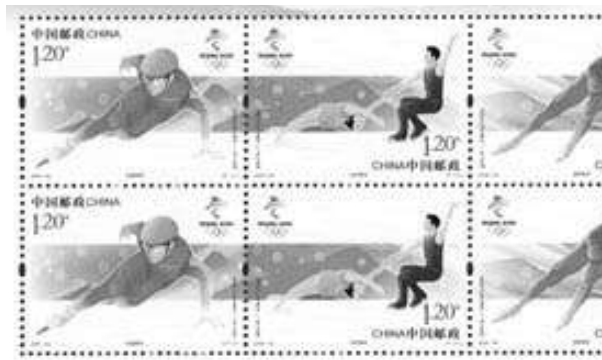
▲2020-25《北京2022年冬奥会“冰上运动”》纪念邮票

早在2015年7月31日，国际奥委会第128次全会投票决定，北京携手张家口获得2022年冬奥会和冬残奥会举办权。按照惯例，当晚，中国邮政特别发行《北京申办2022年冬奥会成功纪念》邮票一套一枚，志号为特10-2015，面值1.2元。此套邮票设计突出表现了北京申办2022年冬奥会