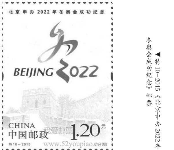
▲特10-2015《北京申办2022年冬奥会成功纪念》邮票

2月4日，北京冬奥会开幕式在京举行，中国邮政发行《第24届冬季奥林匹克运动会开幕纪念》纪念邮票，一套2枚，邮票图案名称为“共向未来、希望之光”。该套邮票整体主要采用白、蓝两色，突出冰雪盛会概念。邮票画面将冬奥