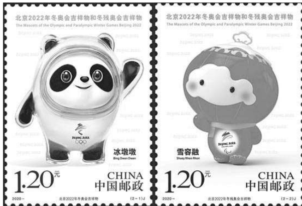
▲2020-2《北京2022年冬奥会吉祥物和冬残奥会吉祥物》纪念邮票

珠光绚丽效果，与北京申办冬奥会口号“纯洁的冰雪·激情的约会”完美融合。北京申办冬奥会标志，由一个运动的人物形象和“2022”中的第一个数字组成汉字“冬”，将抽象的滑道、冰雪运动形态与书法巧妙结合，既展现了冬季运动的活力与激情，更传递出中国文化的独特魅力。彰显动感、时尚和现代，将中国文化、体育和奥林匹克精神相融合。