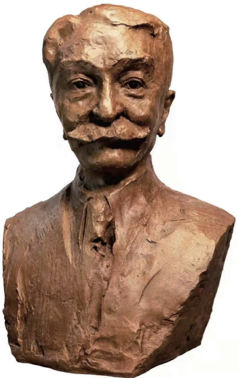
《顾拜旦》铜像雕塑 76cm×60cm×40cm 2017年 吴为山 作 国际奥委会总部藏