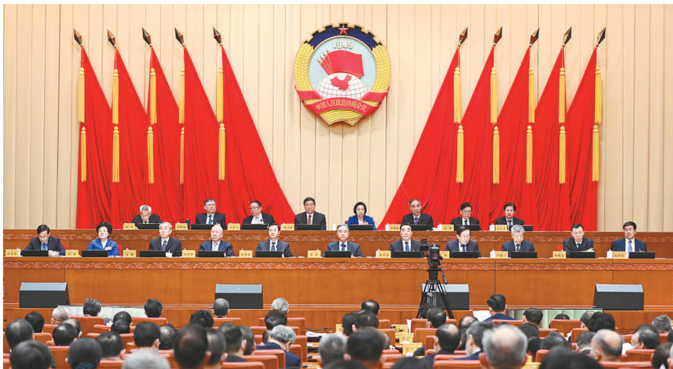
三月一日，政协第十三届全国委员会常务委员会第二十次会议在北京开幕。中共中央政协主席汪洋出席。